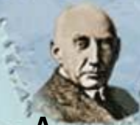
Р. Амундсен 1912 г.