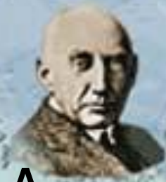
Р. Адмунсен 1912 г.