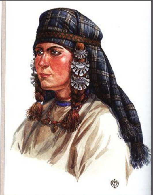
Ленточный убор с височными кольцами. По материалам подмосковных курганов вятичей (рис. 2).