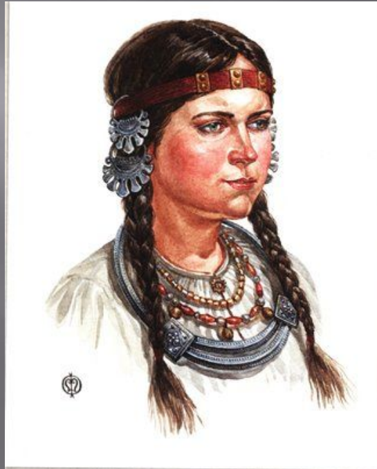
Височные кольца — украшения кос. По материалам подмосковных курганов вятичей (рис. 1).

Шея украшалась металлическими или медными гривнами из гладкой или витой проволоки, ожерельем из различного бисера. Головной убор делался из кожи или ремня, на котором со стороны висков помещались проволочные кольца.