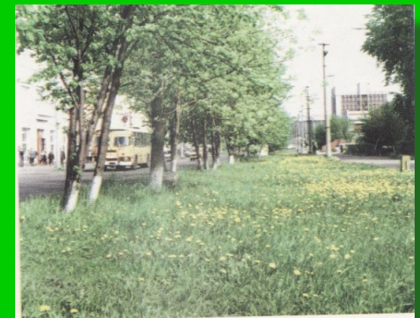
Вид на центр города.