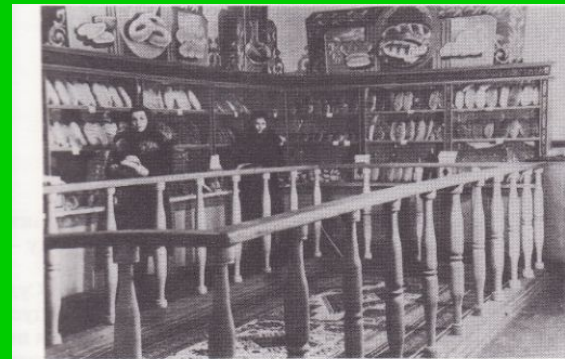
Булочная — один из первых магазинов самообслуживания. 1963 г.

В 50-60 увеличивается население Анжеро-Судженска. Так если в 46-м году оно составляло 89 тыс. человек, к 53-му оно выросло до 112 тыс. В этот период начинается благоустройство города.