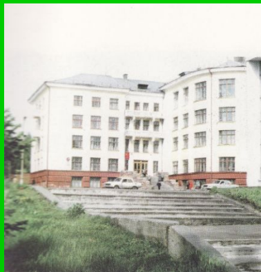
Здание городской администрации.