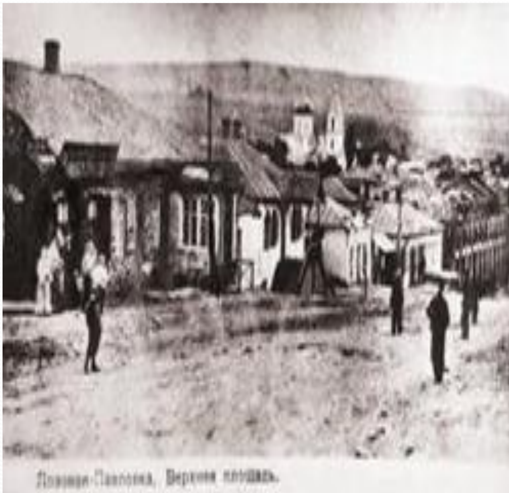
Павловка-Лозовая, Верхняя площадь.

Территория современной Брянки сложилась в результате слияния сел Овраг Каменный, Проток Гриценко, Лозовая Павловка, Краснополье, Сабовка, Замковка, Ломоватка и др. Первыми поселенцами были запорожские казаки. В 1696 году основан Овраг Каменный, в 1709 году - Проток Гриценко на реке Лозовой, в 1709 году поселение Замковское. Это были первые поселения Кальмиуской паланки Запорожской Сечи. В 1728 г. помещик В.М. Акимов основал село Анновку, князь С.Н. Терентьев. - Село Лозовое в 1730 г., а в 1776 г. П. И. Миокович - село Павловку и Петровку. В 1805 году из этих поселений образовалась большая слобода Павловка Лозовая. За семь верст от нее помещик Сабо основал село Сабовку, недалеко появились Краснополье и Ломоватка.