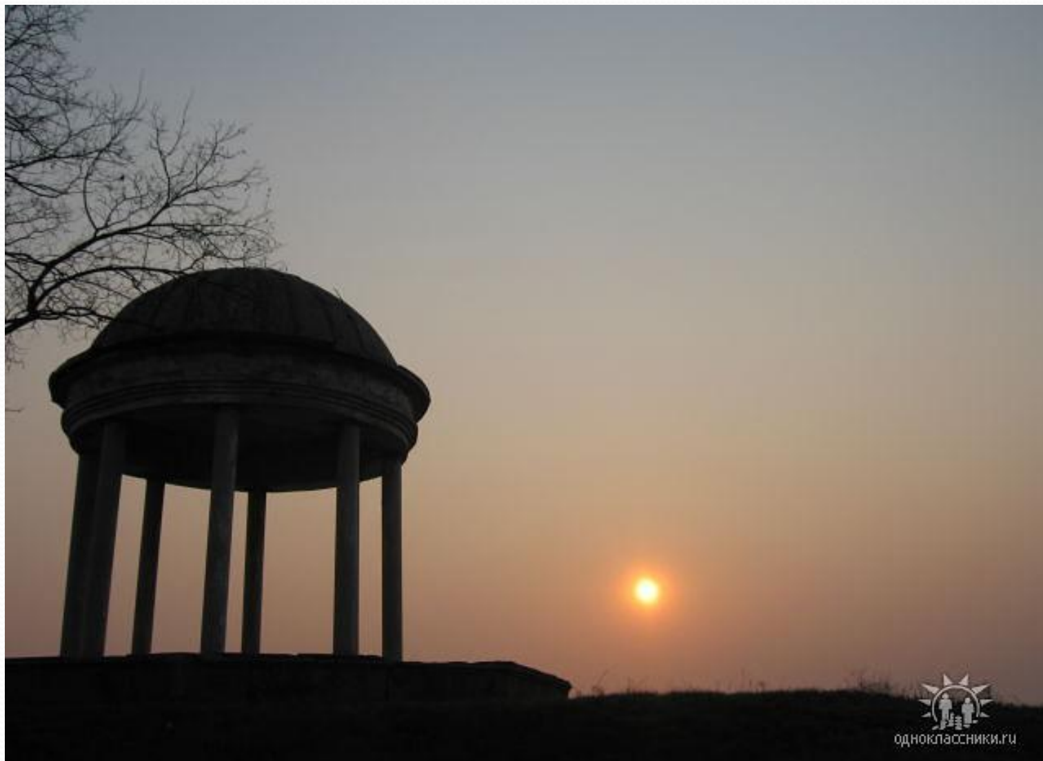
Ротонда в городском парке.