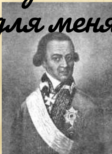
Абрам Петрович Ганнибал, прадед Александра Сергеевича Пушкина. ( портрет написан около 1790 г )

«Там некогда гулял и я: Но вреден север для меня...»