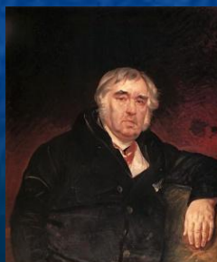
И. А. Крылов