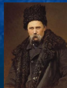
Т. Г. Шевченко