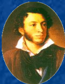
А. С. Пушкин

С Оренбургом связаны имена Н. М. Карамзина, Г. Р. Державина, И. А. Крылова, А. С. Пушкина, Т. Г. Шевченко, А. Н. Плещеева, В. И. Даля. А. С. Пушкин посетил Оренбург в 1833, когда собирал материал о восстании Пугачева. Результатом его поездки стали повесть "Капитанская дочка" и "История Пугачевского бунта".