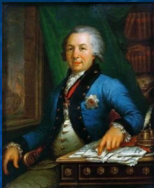
Г. Р. Державин

О городе Оренбурге упоминается в повести А.С.Пушкина «Капитанская дочка». Основное действие в повести происходит в Белогорской крепости, которая располагалась в Оренбургской губернии.