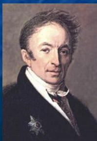
Н. М. Карамзин