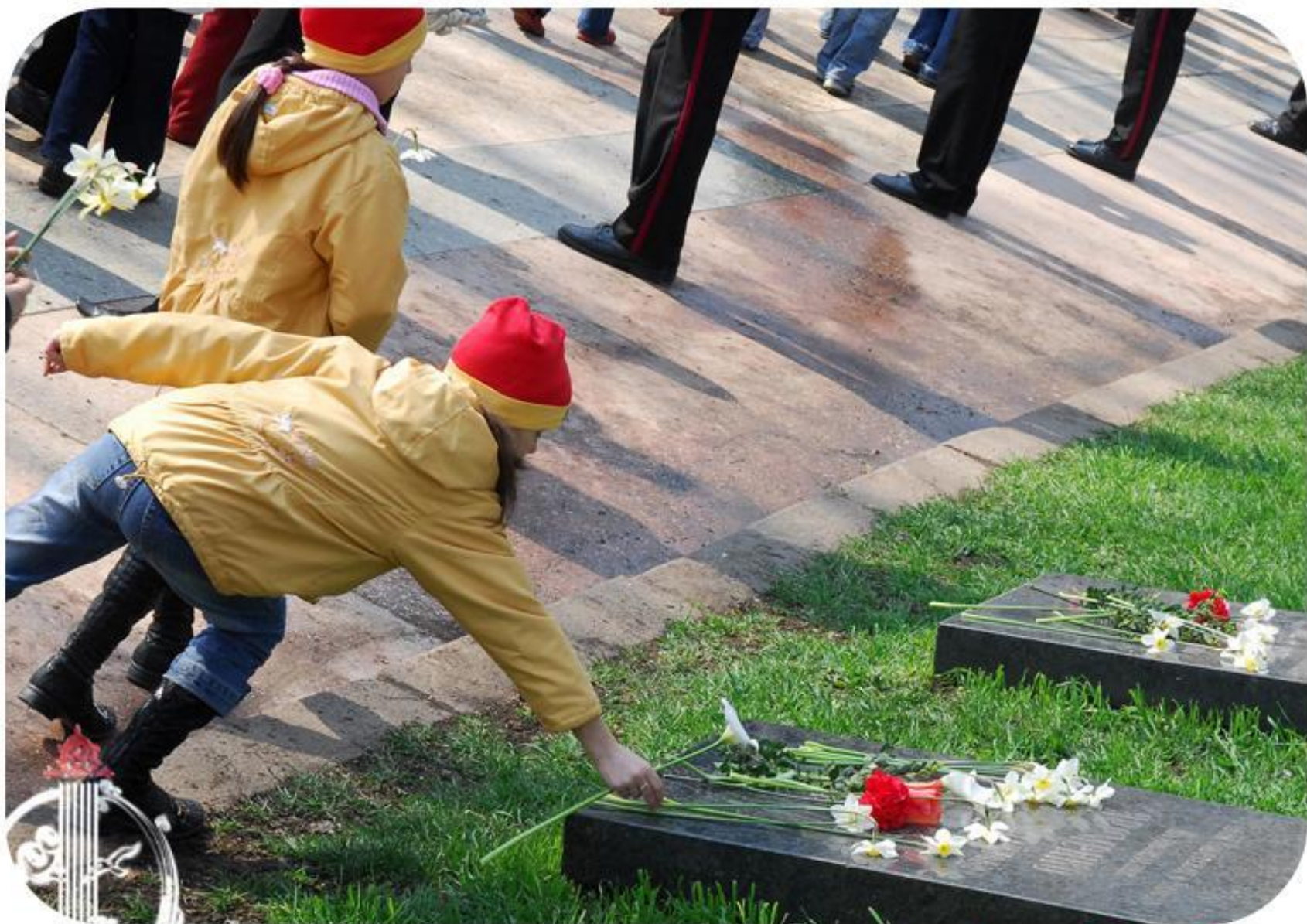
Вечная Слава Героям Everlasting glory to Heroes