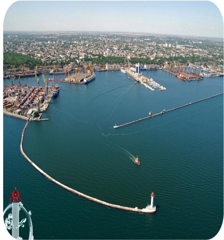
Одесса с высоты птичьего полета Odessa from the bird's-eye view