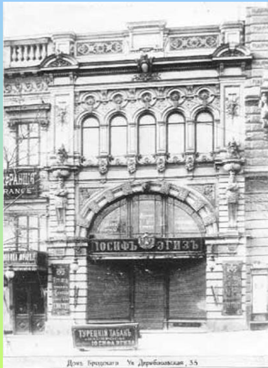
Домъ Греховати Ул. Дерибасовская, 55

Улица Дерибасовская - любимая улица одесситов, с этой улицей связаны многие незабываемые страницы истории города.