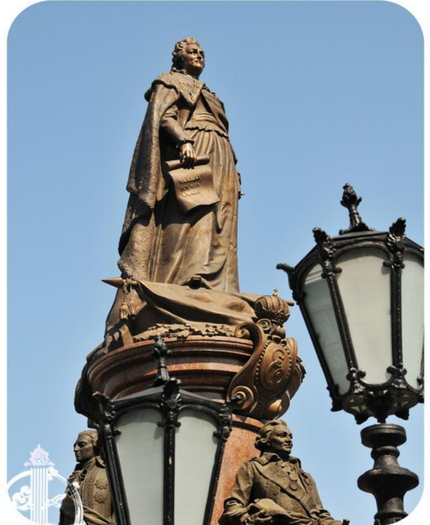
Памятник основателям Одессы Monument to the Founders of Odessa

2 сентября 1794 года и является днем рождения города Одессы.