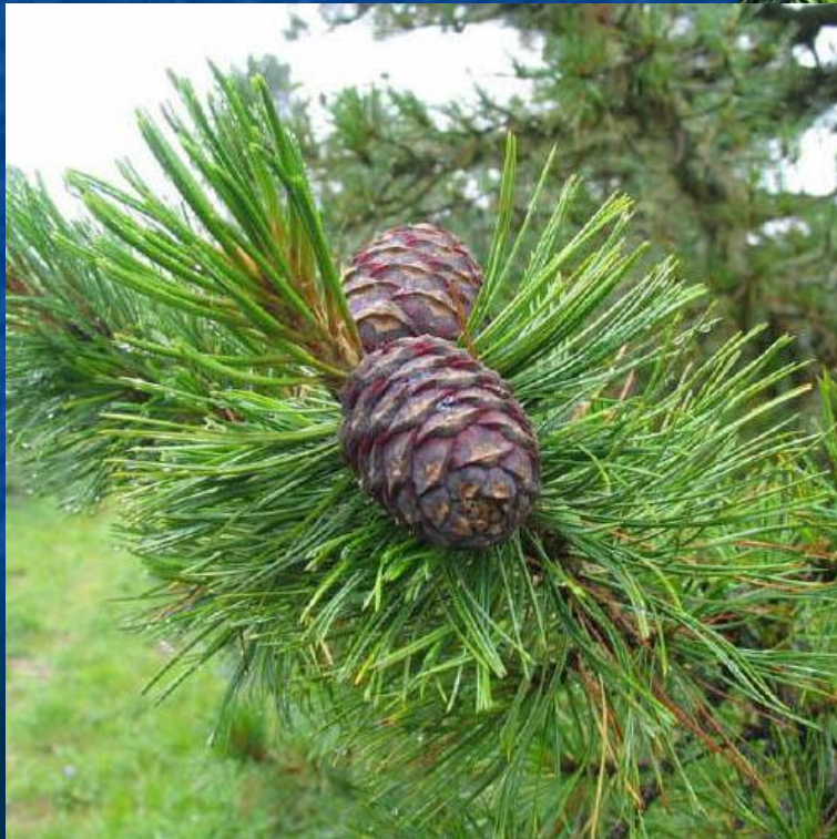
Сосна кедровая сибирская