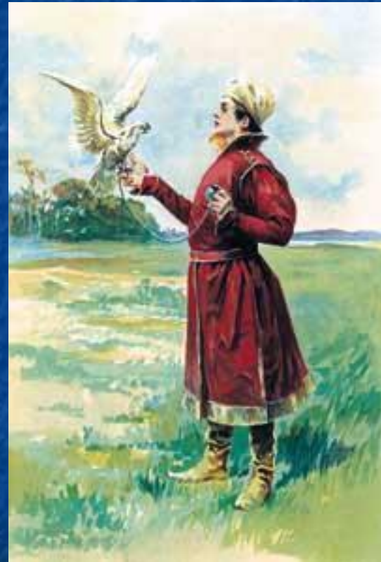
Царский сокольник С картины Н.С. Самокиш

16 век – Беловежская Пуща – место охоты короля Сигизмунда I 17-18 век - Сокольники, Лосиный остров