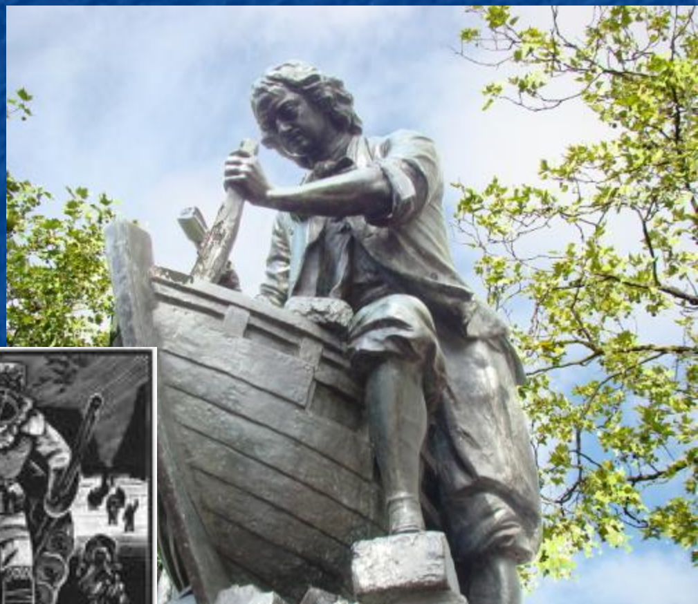
Памятник Петру I в г. Заандаме