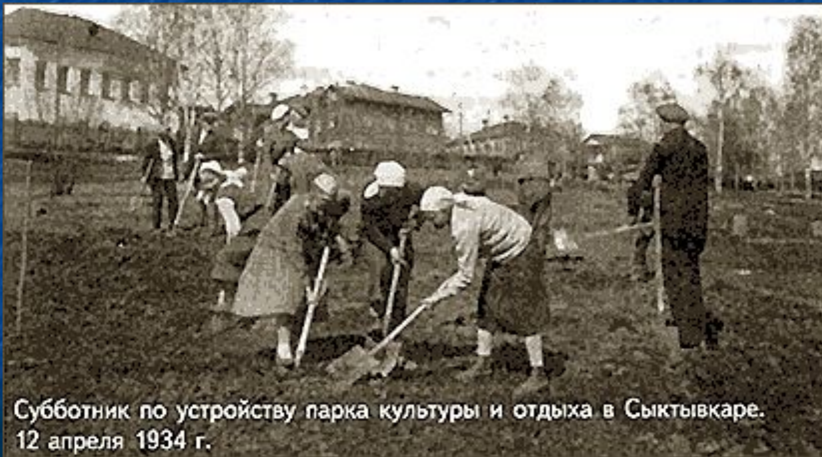
Субботник по устройству парка культуры и отдыха в Сыктывкаре. 12 апреля 1934 г.

С к.40-х г. начинается II этап формирования сети ОПТ – средозащитный. 1948 г. – вокруг г. Сыктывкара выделена зеленая зона.