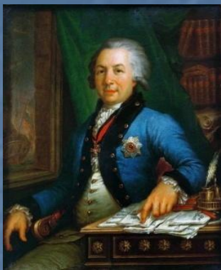
Г. Р. Державин

О городе Оренбурге упоминается в повести А.С.Пушкина «Капитанская дочка». Основное действие в повести происходит в Белогорской крепости, которая располагалась в Оренбургской губернии.