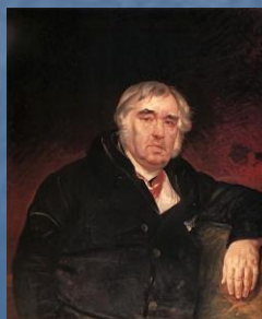
И. А. Крылов