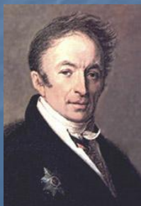
Н. М. Карамзин