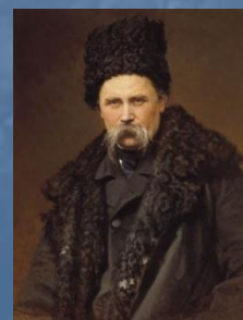
Т. Г. Шевченко