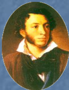
А. С. Пушкин

С Оренбургом связаны имена Н. М. Карамзина, Г. Р. Державина, И. А. Крылова, А. С. Пушкина, Т. Г. Шевченко, А. Н. Плещеева, В. И. Даля. А. С. Пушкин посетил Оренбург в 1833, когда собирал материал о восстании Пугачева. Результатом его поездки стали повесть "Капитанская дочка" и "История Пугачевского бунта".