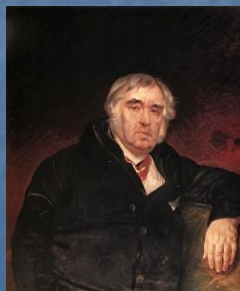
И. А. Крылов