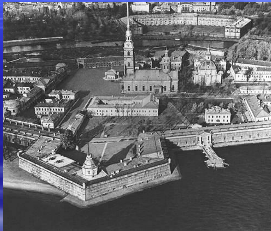
Петропавловская крепость, Нарышкинский бастион и Коммендантская пристань

Работа по строительству дерево-земляной крепости руководил А. Д. Меншиков. За возведением каждого из шести бастионов царь приказал следить своим сподвижникам и приближённым. Один из бастионов, юго-восточный, назван в честь самого царя, а другие бастионы до сих пор носят имена его сподвижников: Нарышкинский (с 1726 г. - Екатерининский), Трубецкой, Зотов, Головкин (с 1730 г. - Аннинский), Меншиков (с 1729 г. - Петровский).