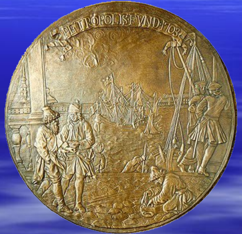
барельеф «Основание Петербурга» скульптор К. Растрелли, XVIII в.

Петропавловская крепость на острове Люст – Эйланд (Весёлый). Эта дата считается днём рождения. Санкт- Петербурга, в этом же году и закончилось её строительство.