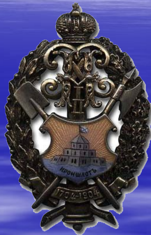
Знак 200 лет крепости Кроншлот

Пётр Первый придавал этой крепости огромное значение. В инструкции коменданту Кроншлота говорилось: «Содержать сию цитадель с Божьей помощью, аще случится, хотя до последнего человека... Зело надлежит стеречься неприятельских брандеров. При приближении к крепости нейтральных кораблей давать по ним предупредительный выстрел, чтобы опустили паруса и бросили якорь; в случае неповиновения открывать огонь». В годы Северной войны войска Кроншлота не раз отражали нападения шведского флота. Пётр утверждал, «что неприятель в море близко появиться не смеет... В Петербурге спать будем спокойно».