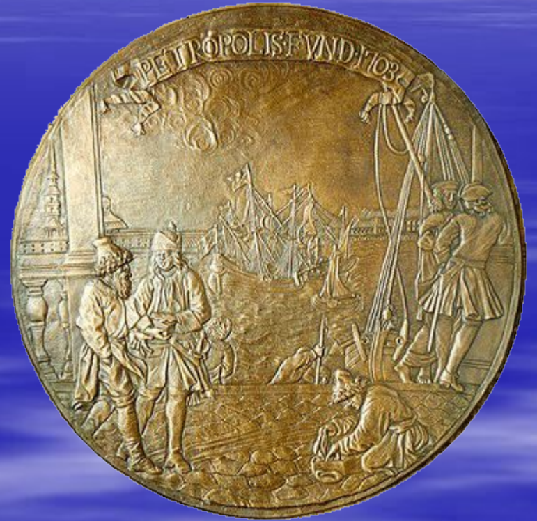
барельеф «Основание Петербурга» скульптор К. Растрелли, XVIII в.

16 мая 1703 года была заложена Петропавловская крепость на острове Люст – Эйланд (Весёлый). Эта дата считается днём рождения. Санкт-Петербурга, в этом же году и закончилось её строительство.