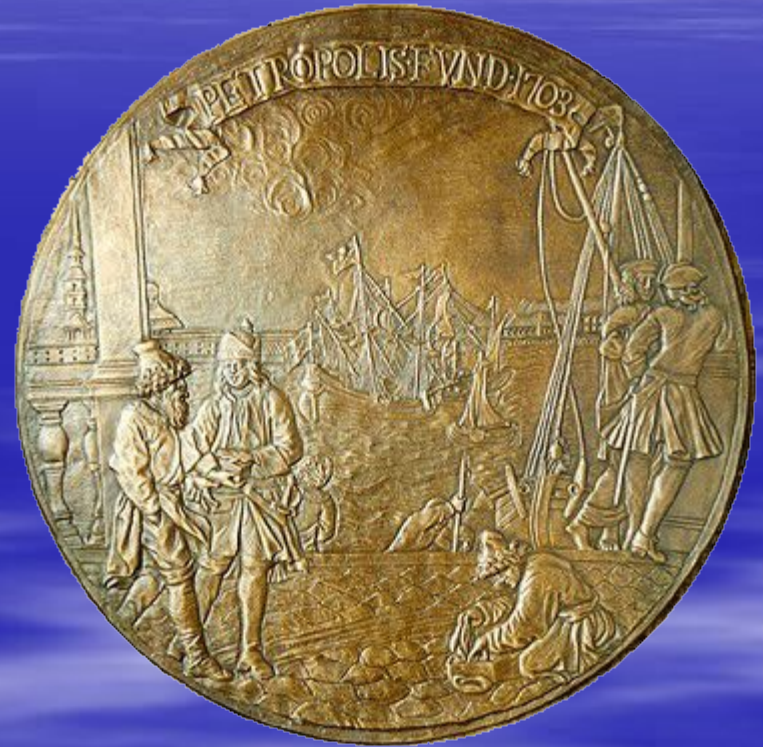
барельеф «Основание Петербурга» скульптор К. Растрелли, XVIII в.

16 мая 1703 года была заложена Петропавловская крепость на острове Люст – Эйланд (Весёлый). Эта дата считается днём рождения. Санкт-Петербурга, в этом же году и закончилось её строительство.