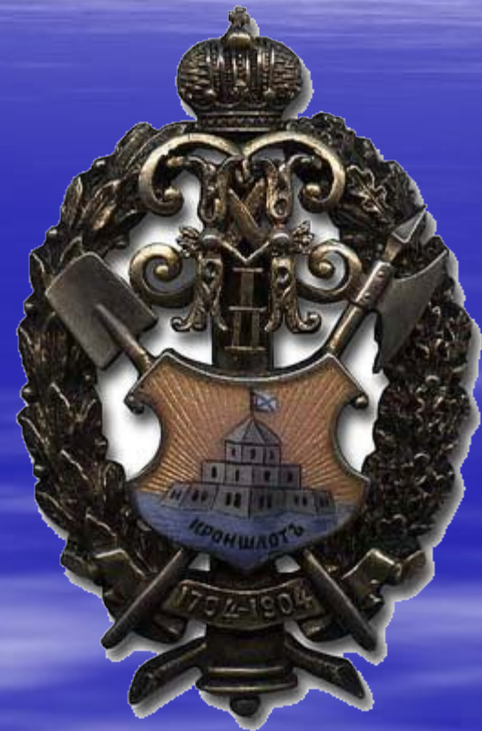
Знак 200 лет крепости Кроншлот

Пётр Первый придавал этой крепости огромное значение. В инструкции коменданту Кроншлота говорилось: «Содержать сию цитадель с Божьей помощью, аще случится, хотя до последнего человека... Зело надлежит стеречься неприятельских брандеров. При приближении к крепости нейтральных кораблей давать по ним предупредительный выстрел, чтобы опустили паруса и бросили якорь; в случае неповиновения открывать огонь». В годы Северной войны войска Кроншлота не раз отражали нападения шведского флота. Пётр утверждал, «что неприятель в море близко появиться не смеет... В Петербурге спать будем спокойно».