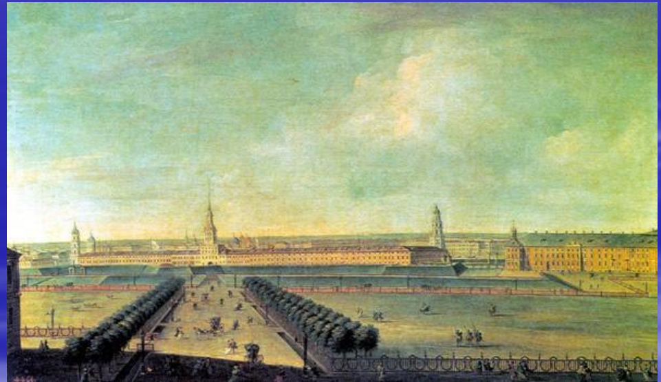
Адмиралтейство. Гравюра А. Зубова, 1716 г.

А в 1704 году на левом берегу Невы заложили главное Адмиралтейство и к 1706 году завершили строительство Адмиралтейской крепости , прикрывавшей южные подступы к Петербургу.