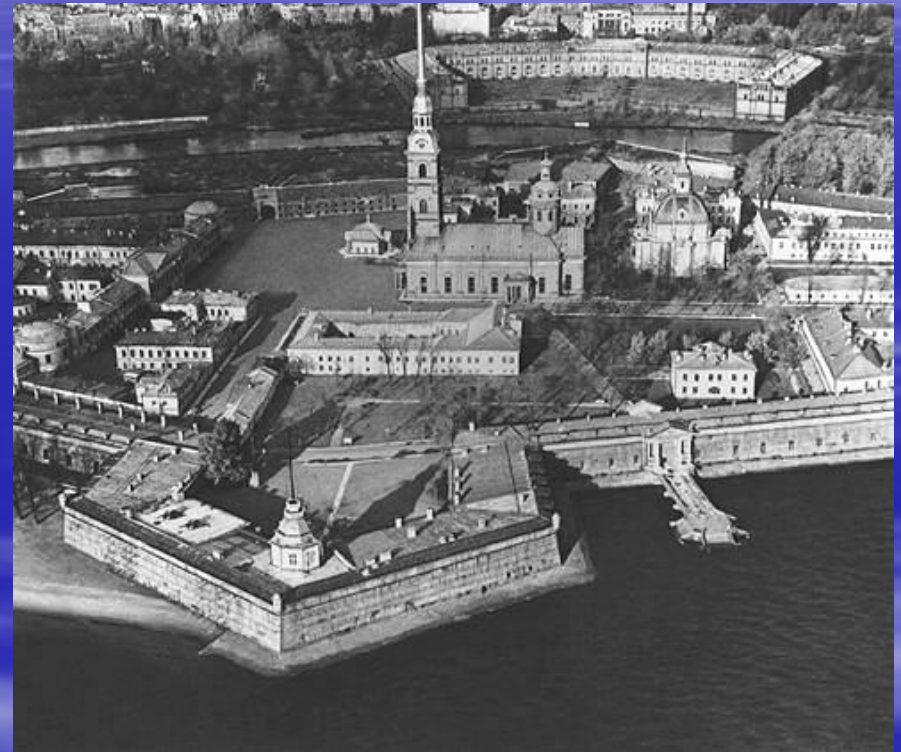
Петропавловская крепость, Нарышкинский бастион и Коммандантская пристань

Работа по строительству дерево-земляной крепости руководил А. Д. Меншиков. За возведением каждого из шести бастионов царь приказал следить своим сподвижникам и приближённым. Один из бастионов, юго-восточный, назван в честь самого царя, а другие бастионы до сих пор носят имена его сподвижников: Нарышкинский (с 1726 г. - Екатерининский), Трубецкой, Зотов, Головкин (с 1730 г. - Аннинский), Меншиков (с 1729 г. - Петровский).