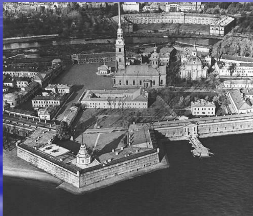
Петропавловская крепость, Нарышкинский бастион и Коммандантская пристань

Работа по строительству дерево-земляной крепости руководил А. Д. Меншиков. За возведением каждого из шести бастионов царь приказал следить своим сподвижникам и приближённым. Один из бастионов, юго-восточный, назван в честь самого царя, а другие бастионы до сих пор носят имена его сподвижников: Нарышкинский (с 1726 г. - Екатерининский), Трубецкой, Зотов, Головкин (с 1730 г. - Аннинский), Меншиков (с 1729 г. - Петровский).