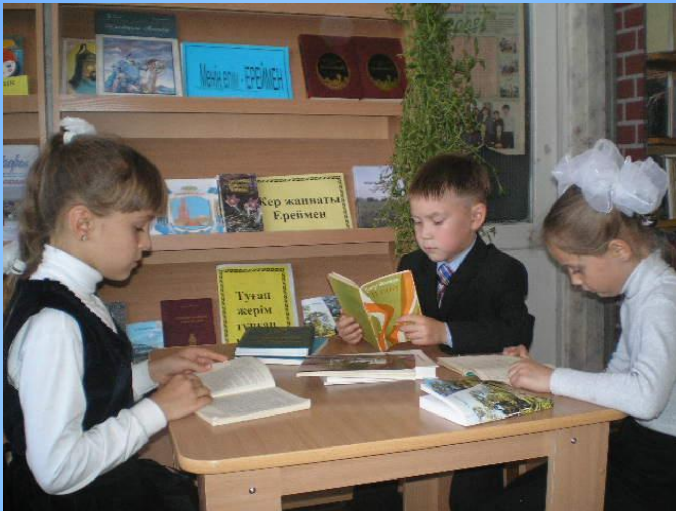
Работа исследовательской группы в районной детской библиотеке