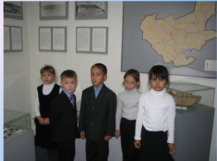
Экскурсия в краеведческий музей г. Ерейментау