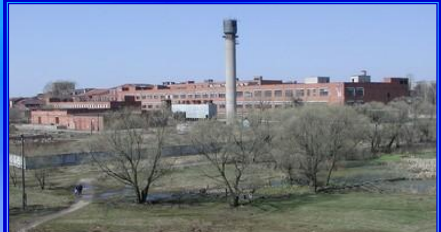
Тейковский ХБК (бывшая фабрика)