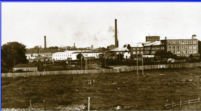
Фабрика Каретникова (фото XIX века)