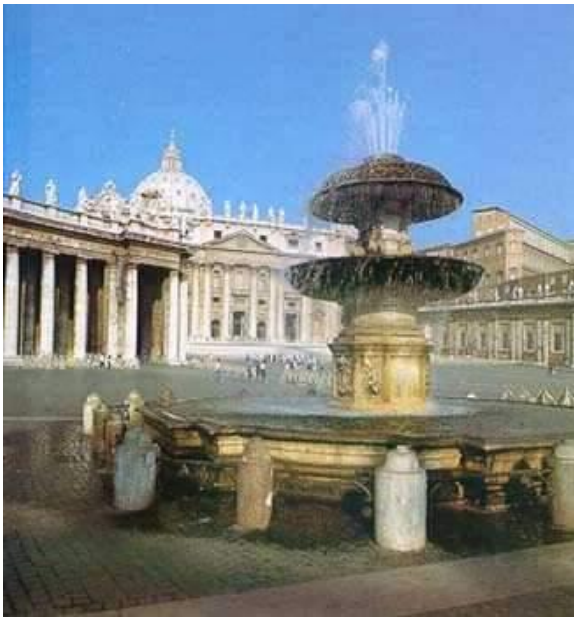
ФОНТАН НА ПЛОЩАДИ СВЯТОГО ПЕТРА