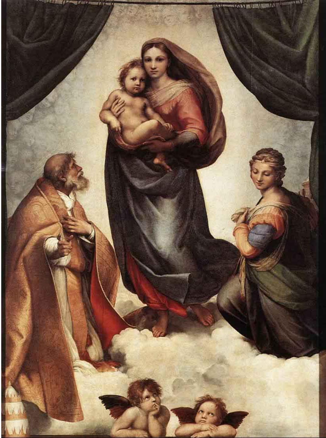
Сикстинская Мадонна. Рафаэль