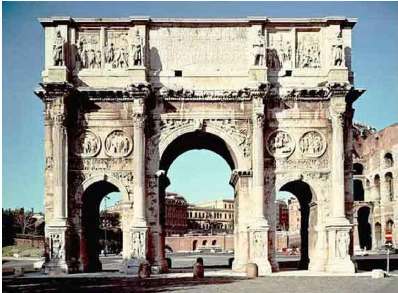
АРКА КОНСТАНТИНА (315 н.э.).