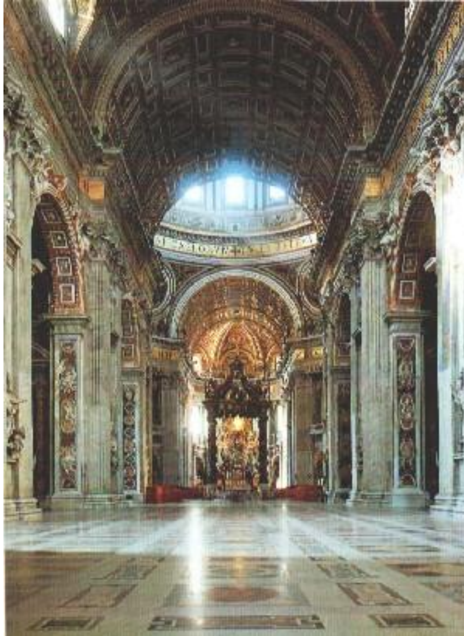
Внутренняя отделка базилики