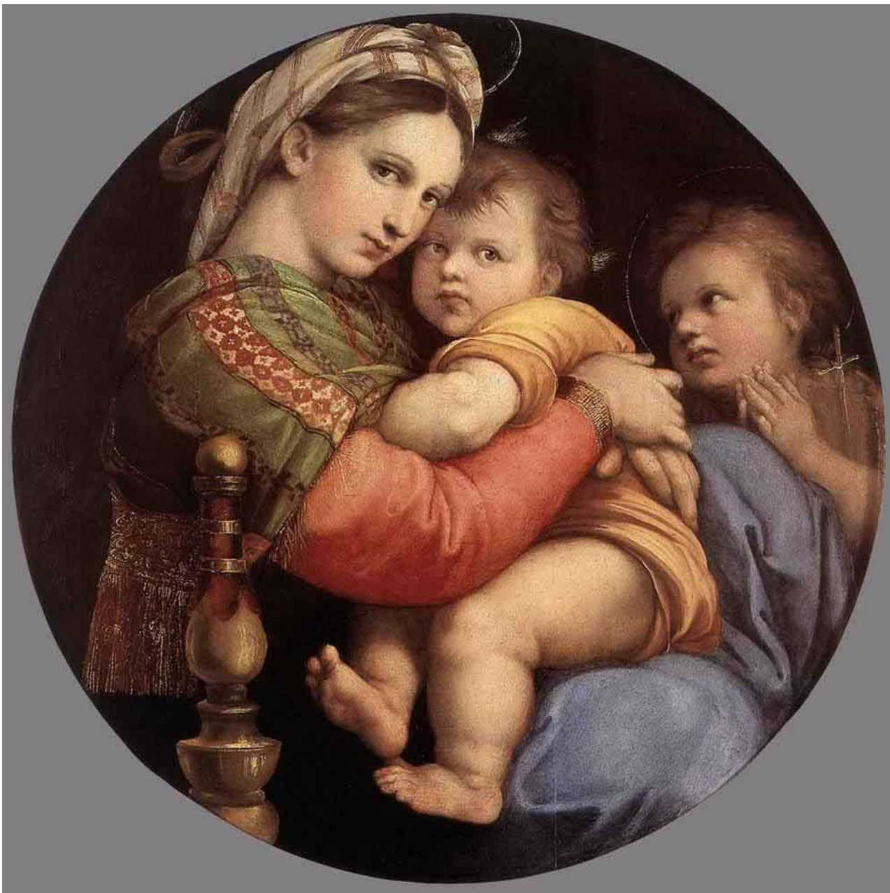
Мадонна с ребёнком. Рафаэль