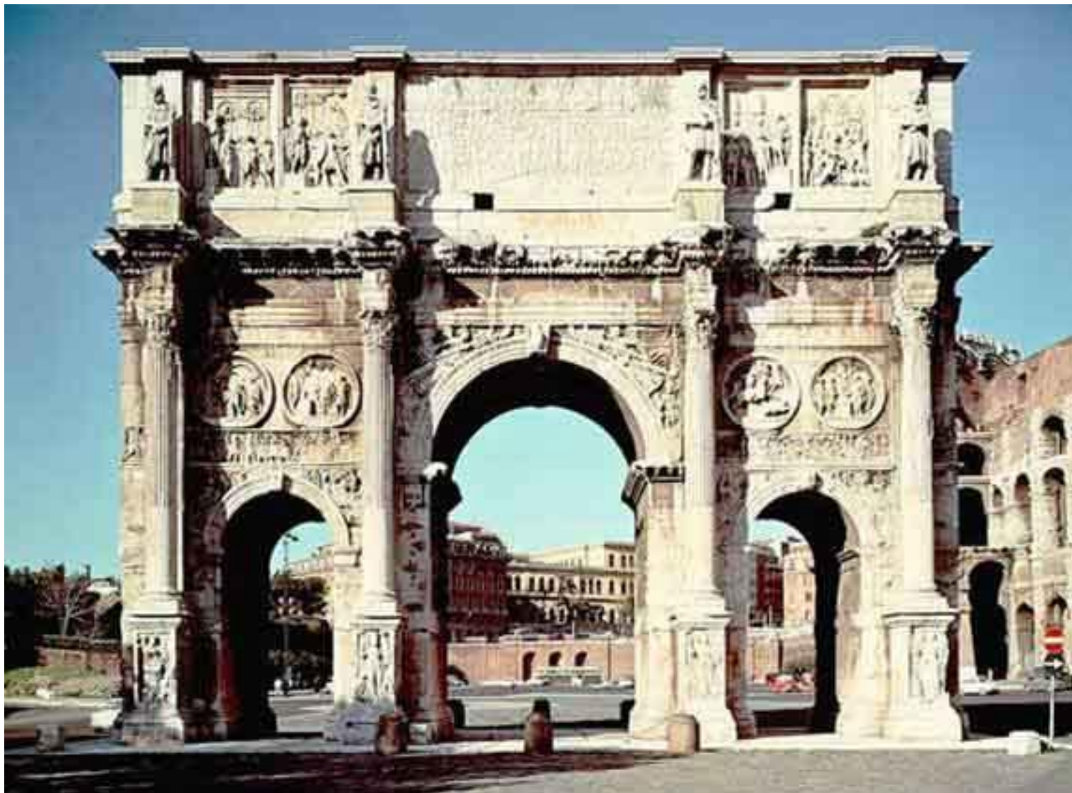
АРКА КОНСТАНТИНА (315 н.э.).