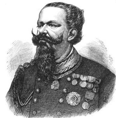
Виктор Эммануил II

Депутаты избирались из 2% жителей страны (мужчин старше 25 лет + имущественный ценз).