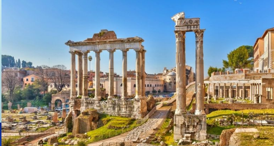
Исторический центр Рима