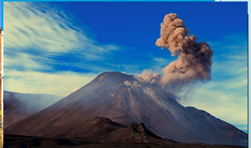
Вулкан Этна на Сицилии