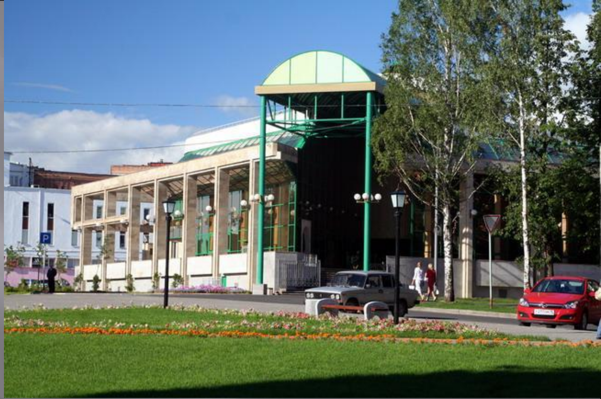
Музейно-выставочный комплекс стрелкового оружия имени М. Т. Калашникова

Удмуртский республиканский музей изобразительных искусств Музей-квартира Геннадия Красильникова Музей Ижмаш Выставочный центр «Галерея» Галерея «Творческая дача»