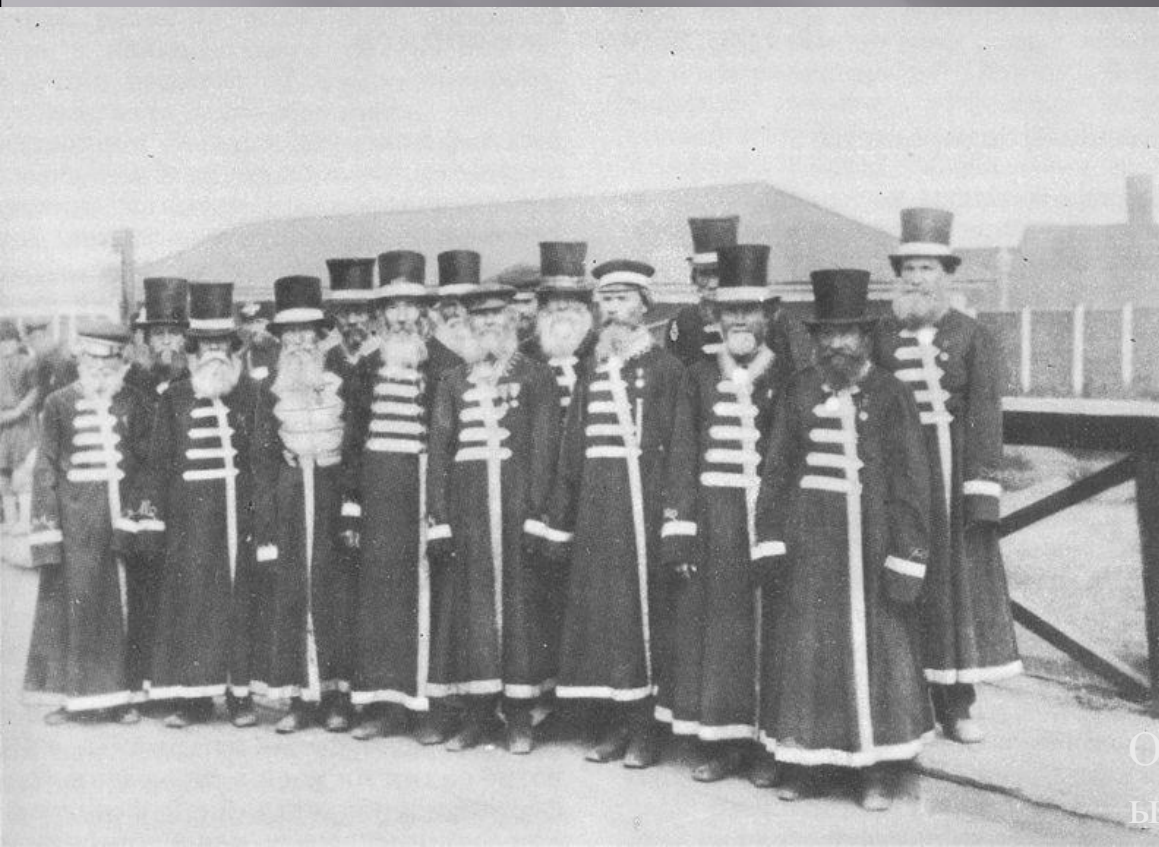
Оружейные мастера Ижевского завода в военные годы.