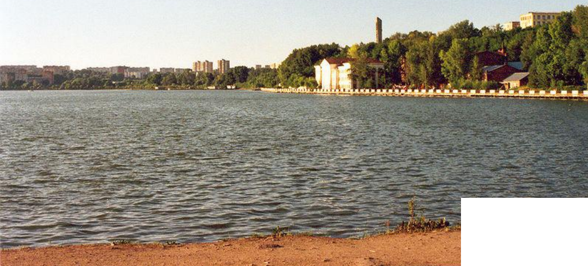
Резиденция президента Удмуртии