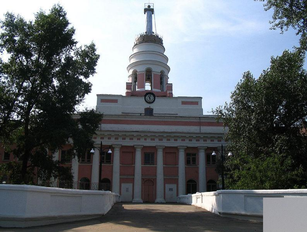
Башня Главного корпуса Ижевского завода (ныне ОАО «Ижмаш»)