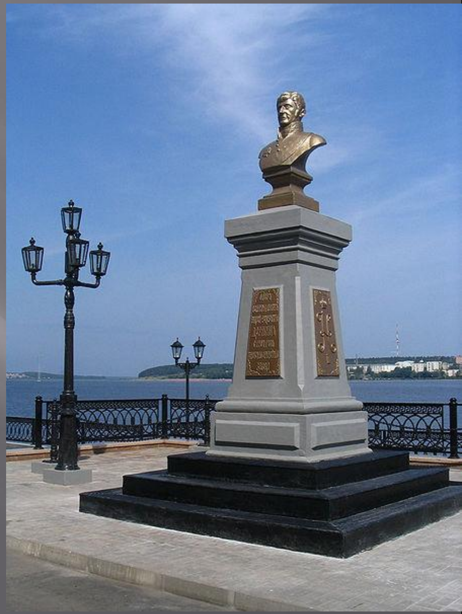
Памятник А. Ф. Дерябину на набережной ижевского пруда