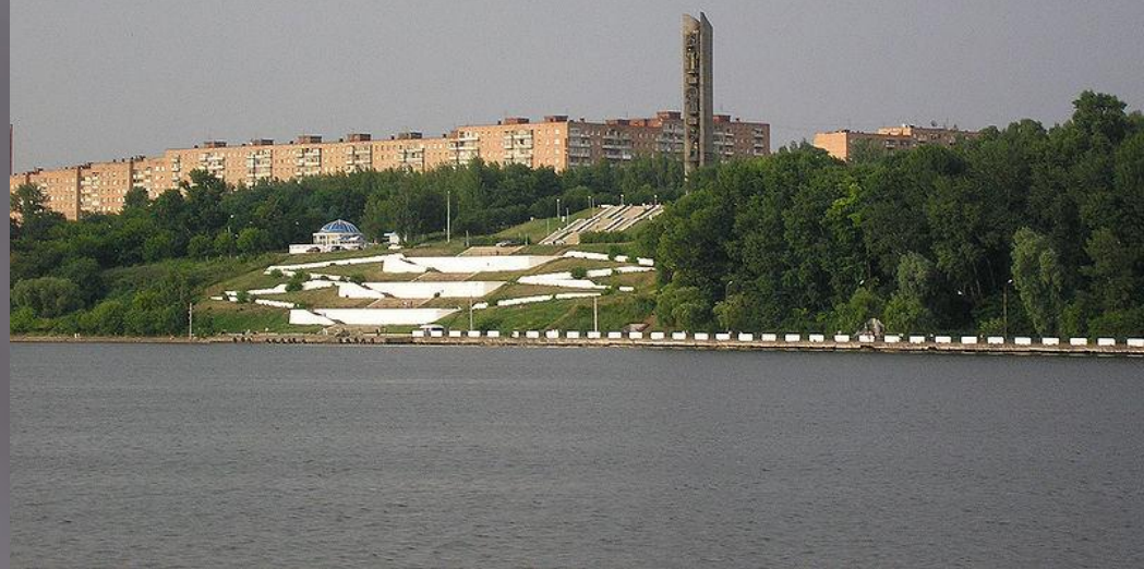
Монумент «Дружба народов»