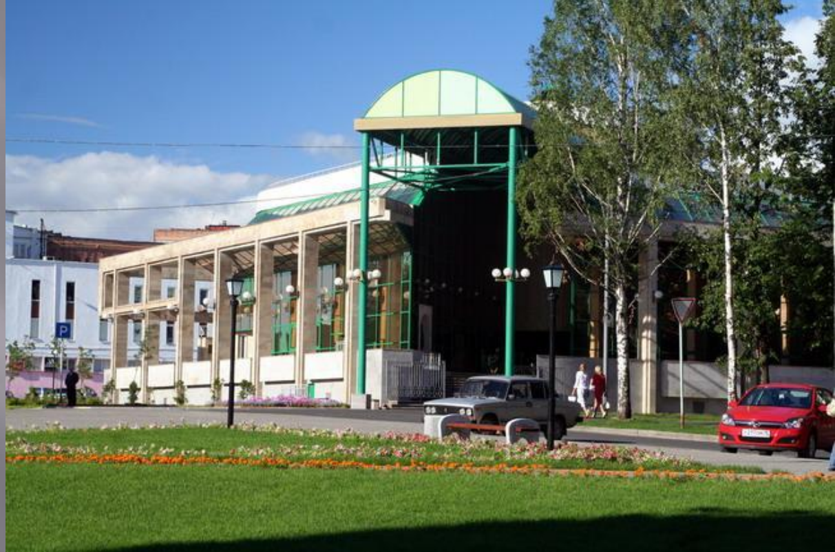
Музейно-выставочный комплекс стрелкового оружия имени М. Т. Калашникова

▣ Национальный музей Удмуртской Республики им. К. Герда (в здании Арсенала)