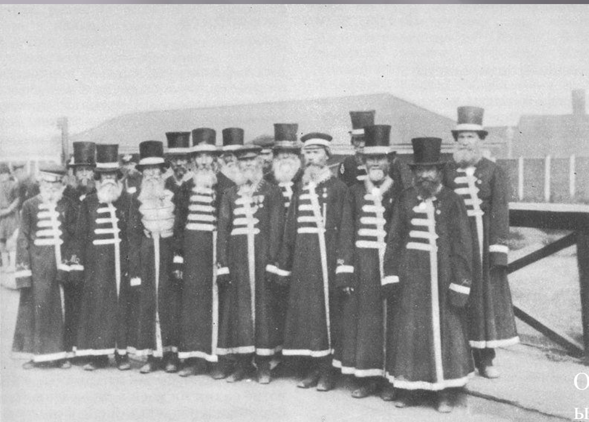
Оружейные мастера Ижевского завода в военные годы.