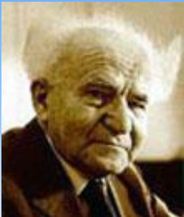
Давид Бен-Гурион, (1948-1954), партия Мапай

Премьер-министр является главой правительства и кабинета министров и пребывает на своём посту 4 года. Премьер-министром, как правило, становится председатель партии, получившей на всеобщих выборах наибольшее число голосов.