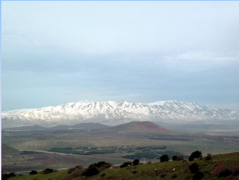
Израильская вершина горы Хермон — вид с горы Бенталь

Туризм, в особенности паломничество, также является важной статьёй доходов Израиля. Благодаря жаркому климату, достопримечательностям и уникальной географии — от заснеженной вершины горы Хермон, где расположена горнолыжная база, и лесов Галилеи до сафари в Иудейской пустыне и пустыне Арава Израиль привлекает большое число туристов. В 2008 году количество туристов, посетивших страну может превысить 2,8 млн человек.