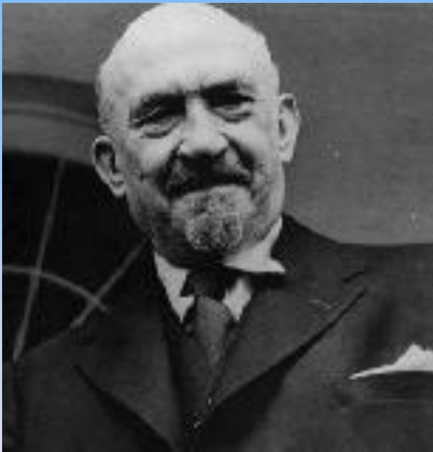
Хаим Вейцман, первый президент Израиля (1949 – 1952)

Президент Израиля является формальным главой государства, однако его обязанности большей частью церемониальные. По закону принятому в 2000 году, президент избирается Кнессетом лишь на одну каденцию сроком 7 лет. До 1963 года, президент избирался на пятилетний срок без ограничения каденций, а в 1963—2000 годах на пятилетний срок с ограничением на две каденции.