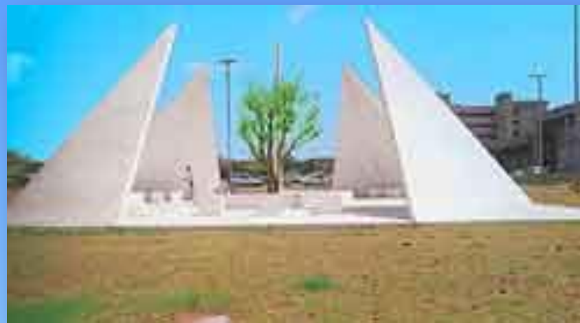
Символ культуры Израиля