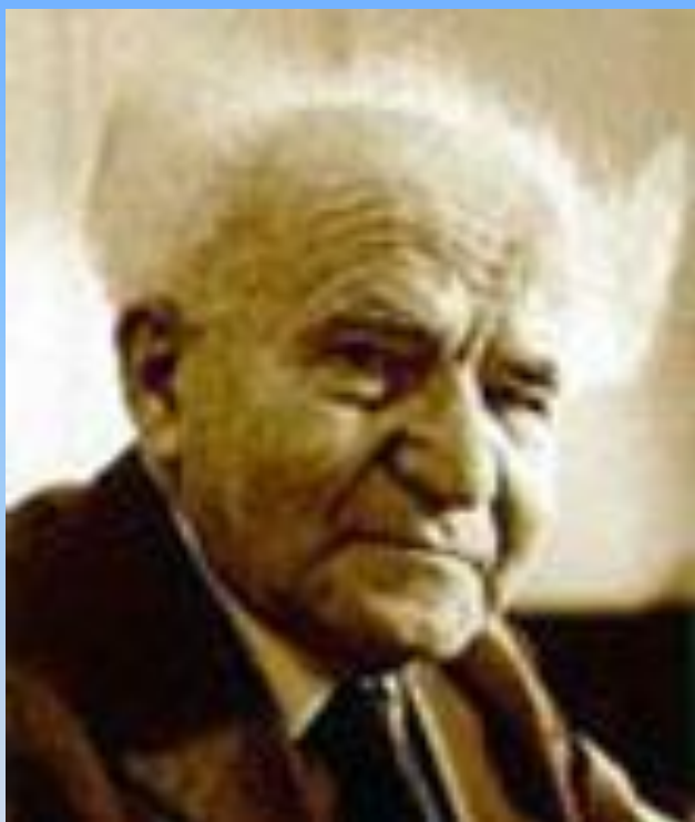
Давид Бен-Гурион, (1948-1954), партия Мапай

Премьер-министр является главой правительства и кабинета министров и пребывает на своём посту 4 года. Премьер-министром, как правило, становится председатель партии, получившей на всеобщих выборах наибольшее число голосов.