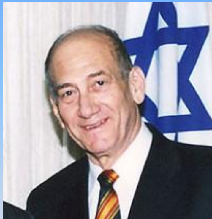
Эхуд Ольмерт, действующий премьер Израиля, выбран в 2006 г., лидер партии Кадима