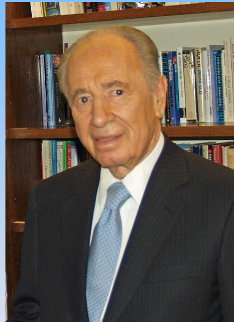
Шимон Перес, президент Израиля, избран в 2007 году