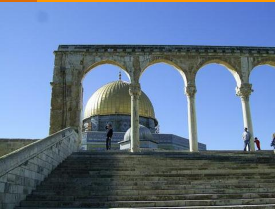
Иерусалим, Храмовая Гора

Полное наименование – Государство Израиль.