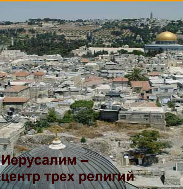
Иерусалим – центр трех религий