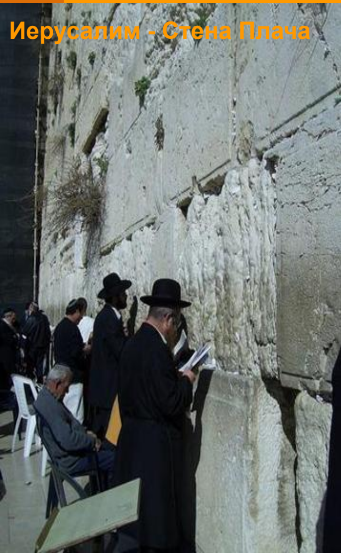
Иерусалим - Стена Плача

Население составляет 5 433 134 человека (1995), включая 122 000 еврейских поселенцев в районе Западного Берега, 14 500 - в районе Голанских высот, 4800 - в секторе Газа и 149 000 - в Восточном Иерусалиме. Средняя плотность населения около 262 человек на км 2 . Большинство жителей - евреи (83%), остальные - арабы 17%. Официальный язык еврейский (иврит), среди арабского населения официальный язык - арабский, распространены так же английский, идиш, русский язык. Иудейскую религию исповедует 82% населения, мусульмане (главным образом сунниты) - 14%, христианство - 2%. Рождаемость - 20,39 новорожденных на 1 000 человек (1995). Смертность - 6,38 смертельных исхода на 1 000 человек (уровень детской смертности - 8,4 смертельных исхода на 1 тыс. Новорожденных). Средняя продолжительность жизни: мужчины - 76 лет, женщины - 80 лет.