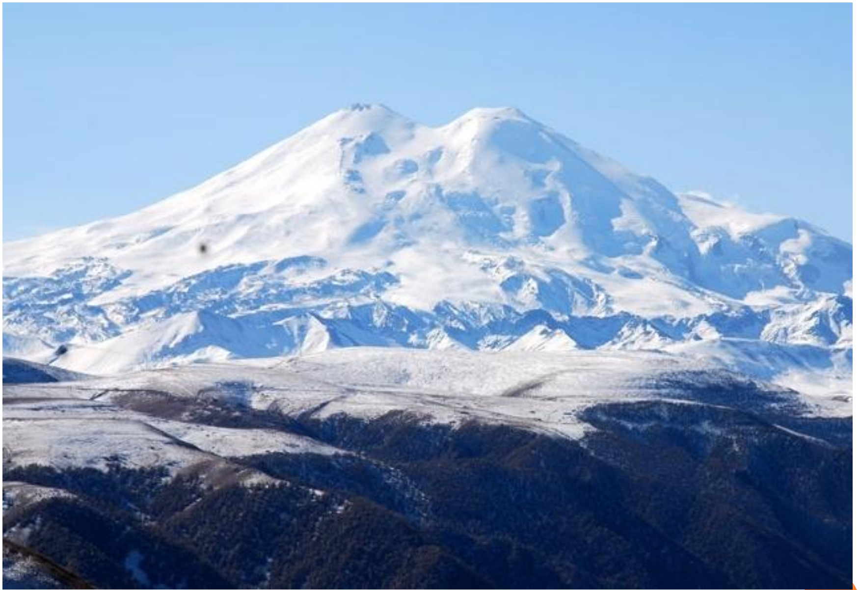
ГОРА ЭЛЬБРУС – 5642 М