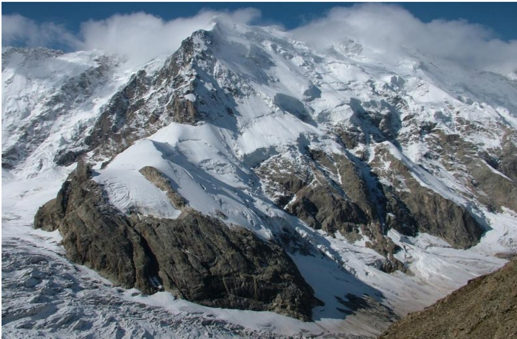
ВЕРШИНА ГЛАВНОГО КАВКАЗСКОГО ХРЕБТА ДЖАНГИТАУ – 5058 м