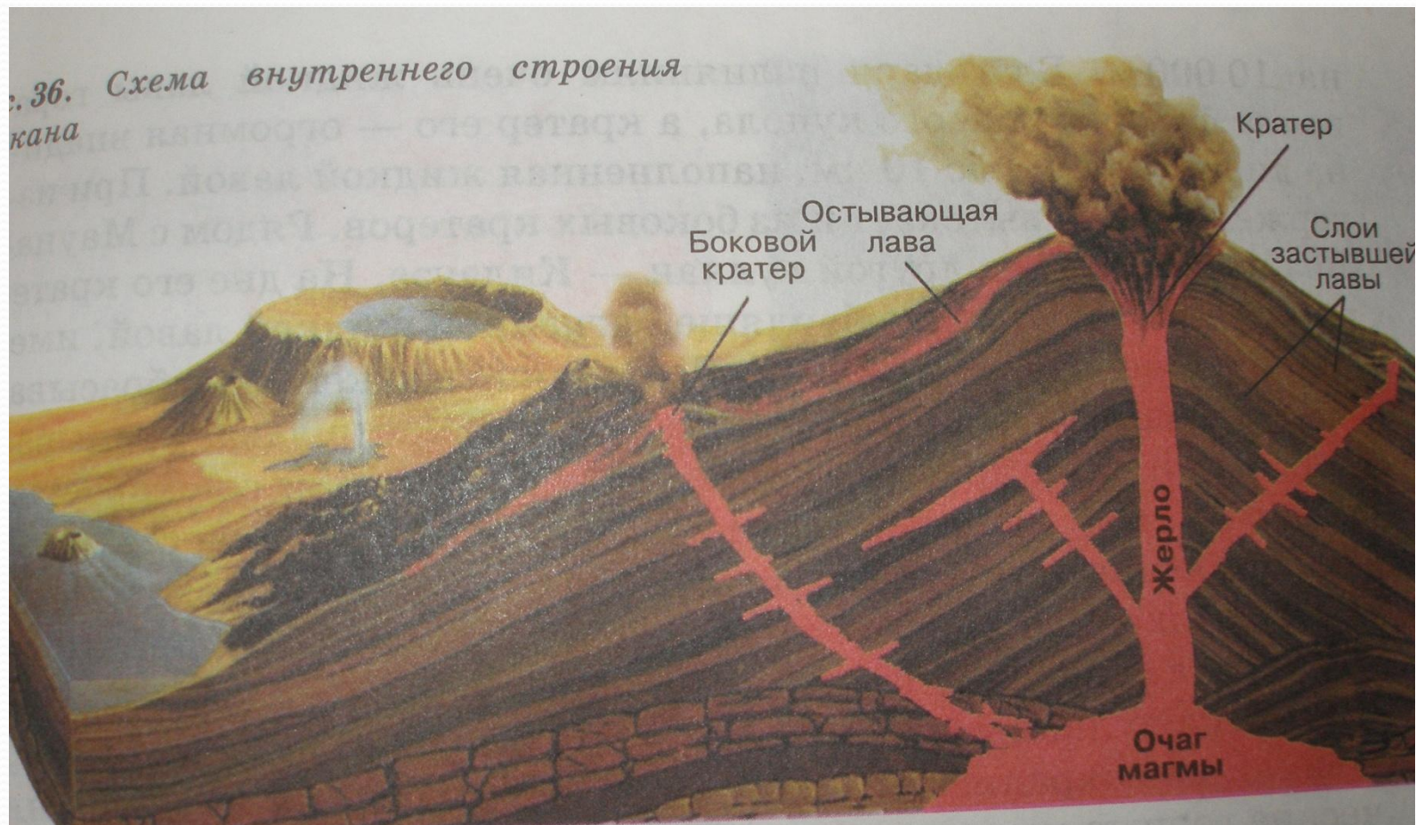
Схема внутреннего строения вулкана