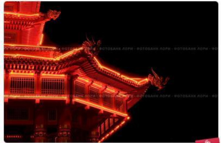
Элиста, Калмыкия. Фрагмент "Пагоды Семи Дней" с ночной подсветкой