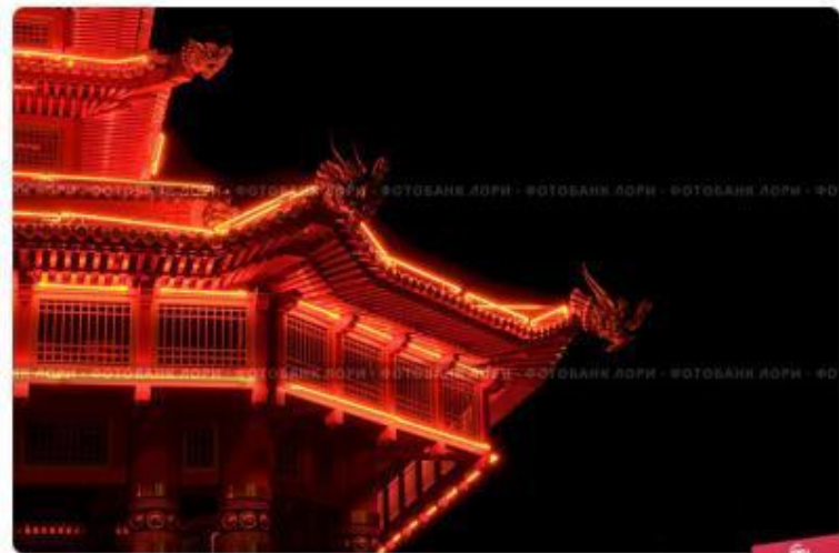
Элиста, Калмыкия. Фрагмент "Пагоды Семи Дней" с ночной подсветкой