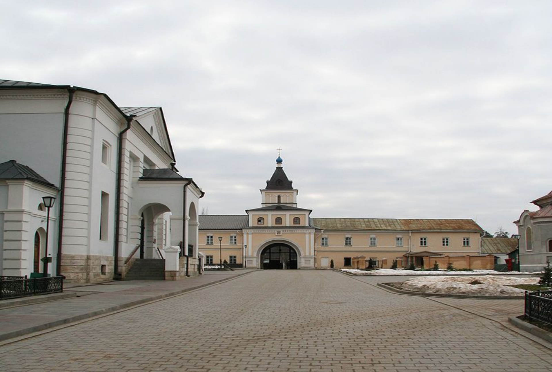
Монастырь «Оптина пустынь»