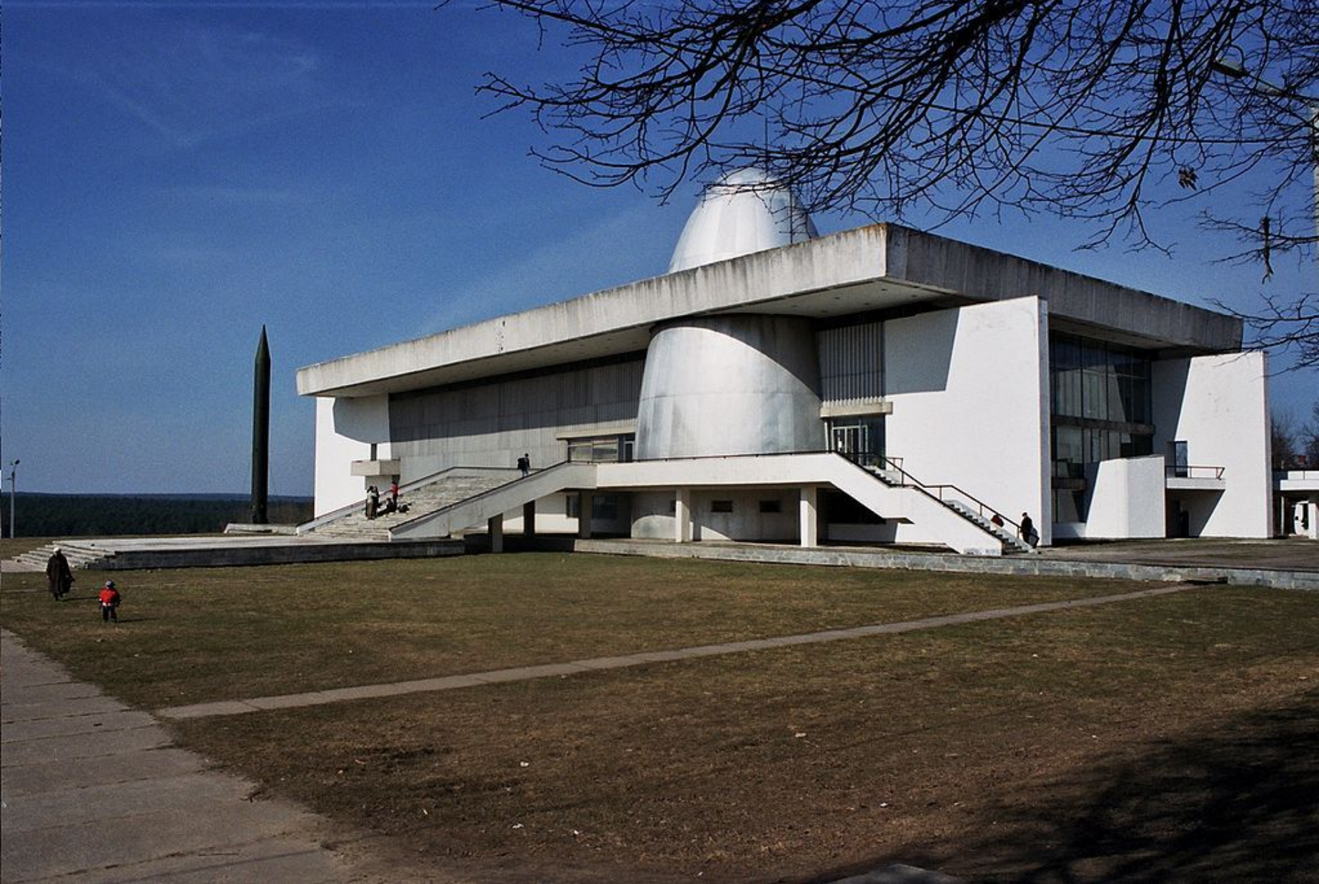
Государственный музей истории космонавтики имени К. Э. Циолковского