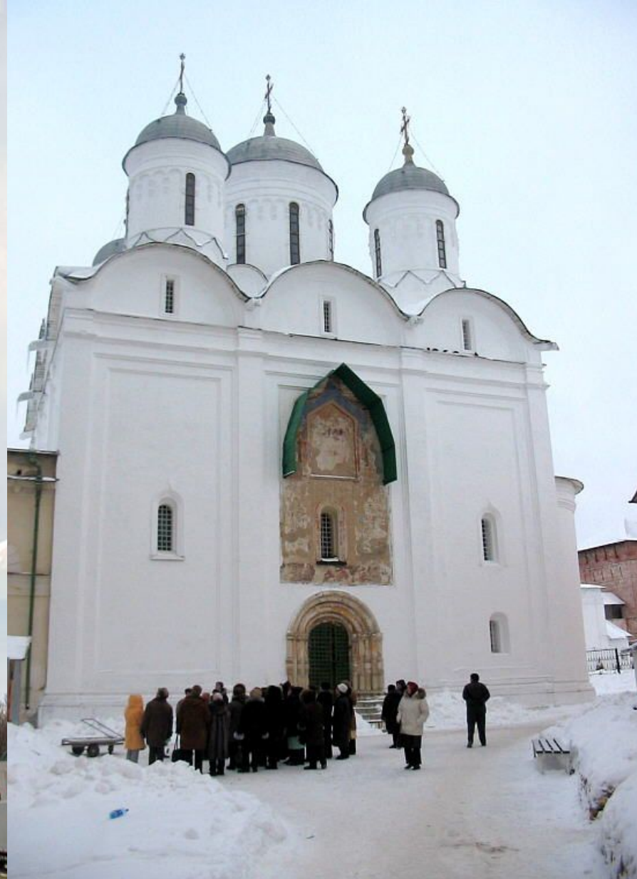
Монастырь Свято-Тихонова пустынь и Свято-Пафнутьев Боровский монастырь