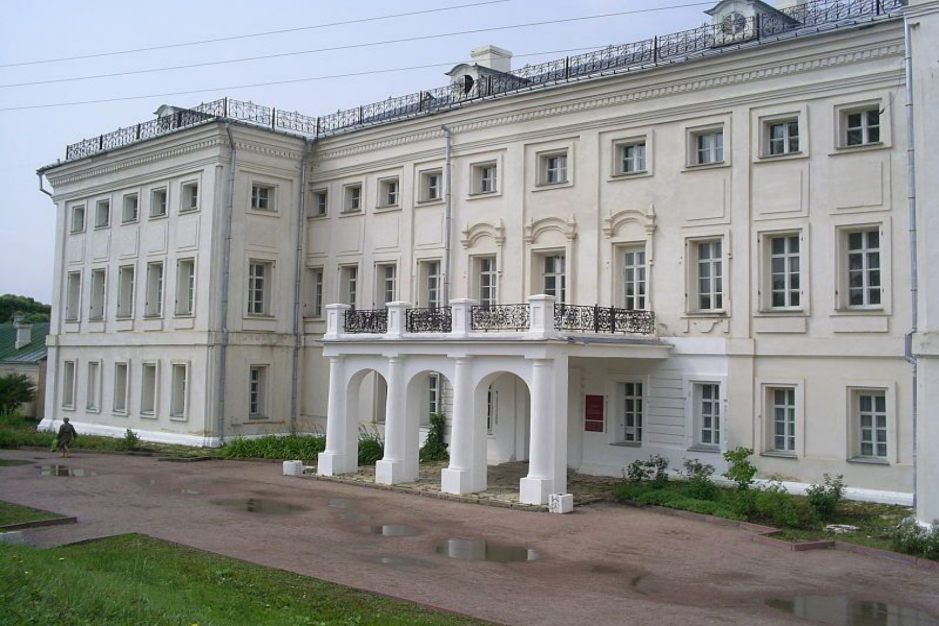
Усадьба Гончаровых в Полотняном заводе