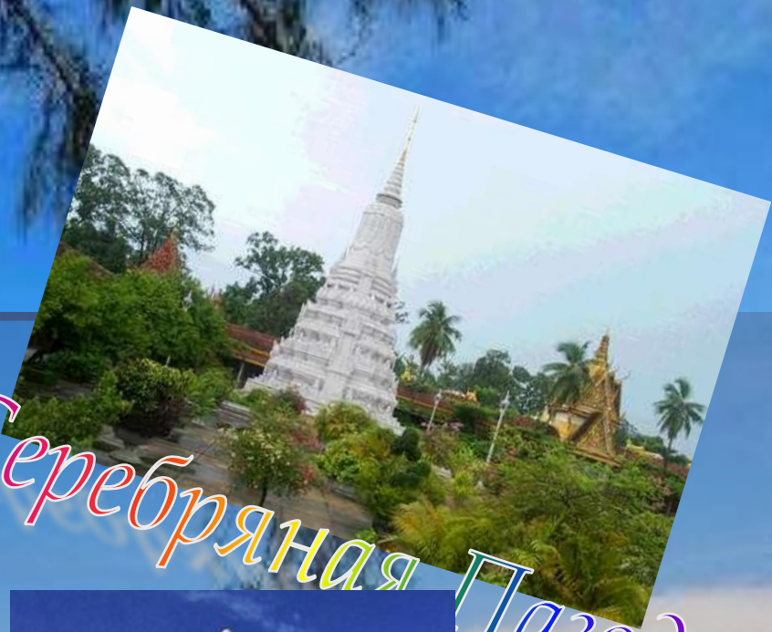
Королевский дворец, Серебряная Пагода