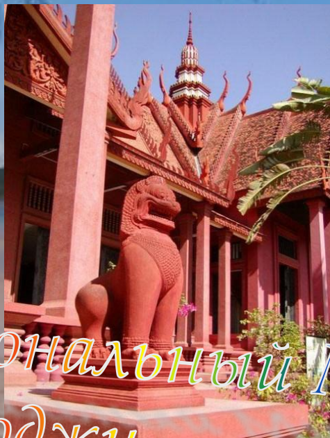
Национальный Музей Камбоджи