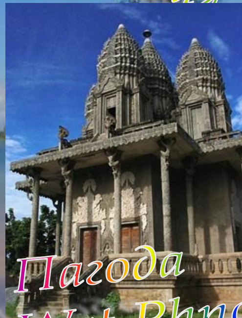
Пагода Wat Phnom