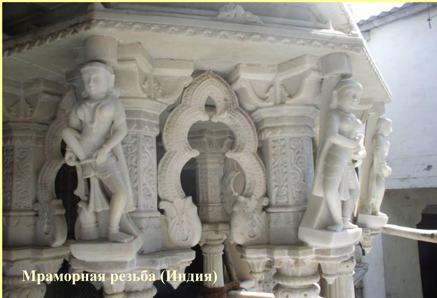
Мраморная резьба (Индия)