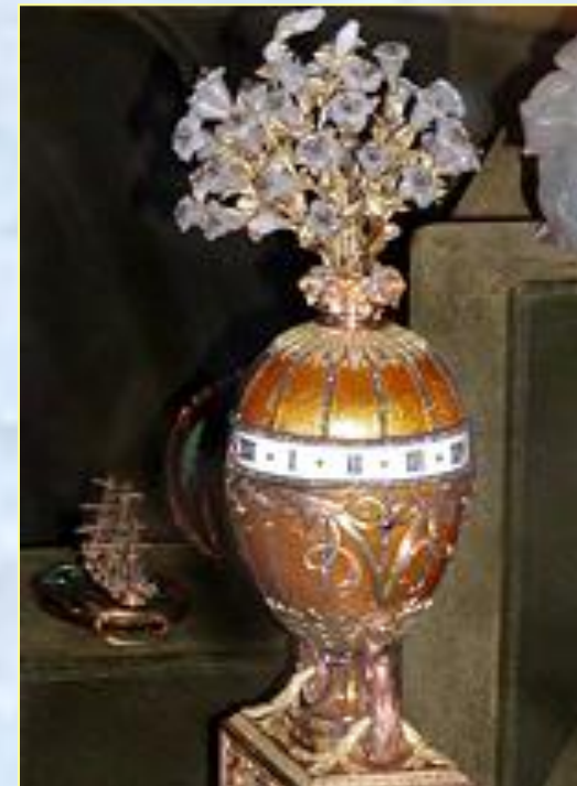
БОЛЬШОЙ БУКЕТ Бриллианты, изумруды, золото, серебро (1760 г.)