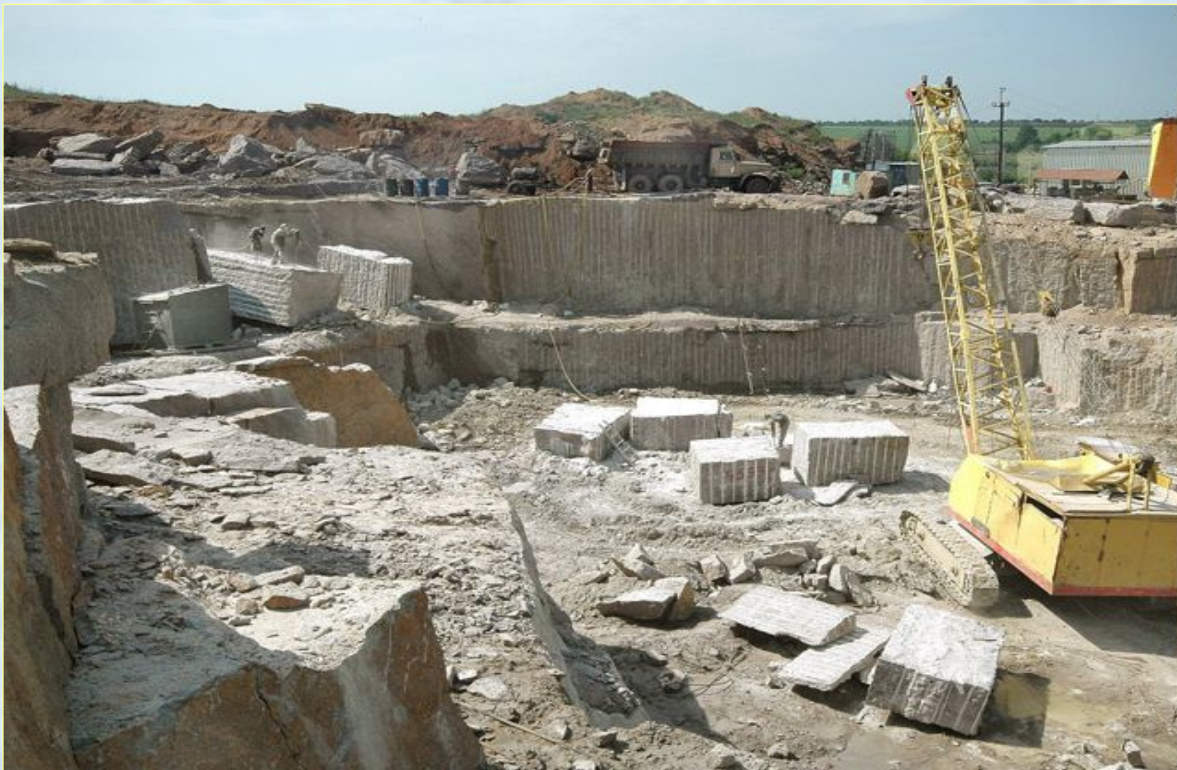
Добыча камня в карьере