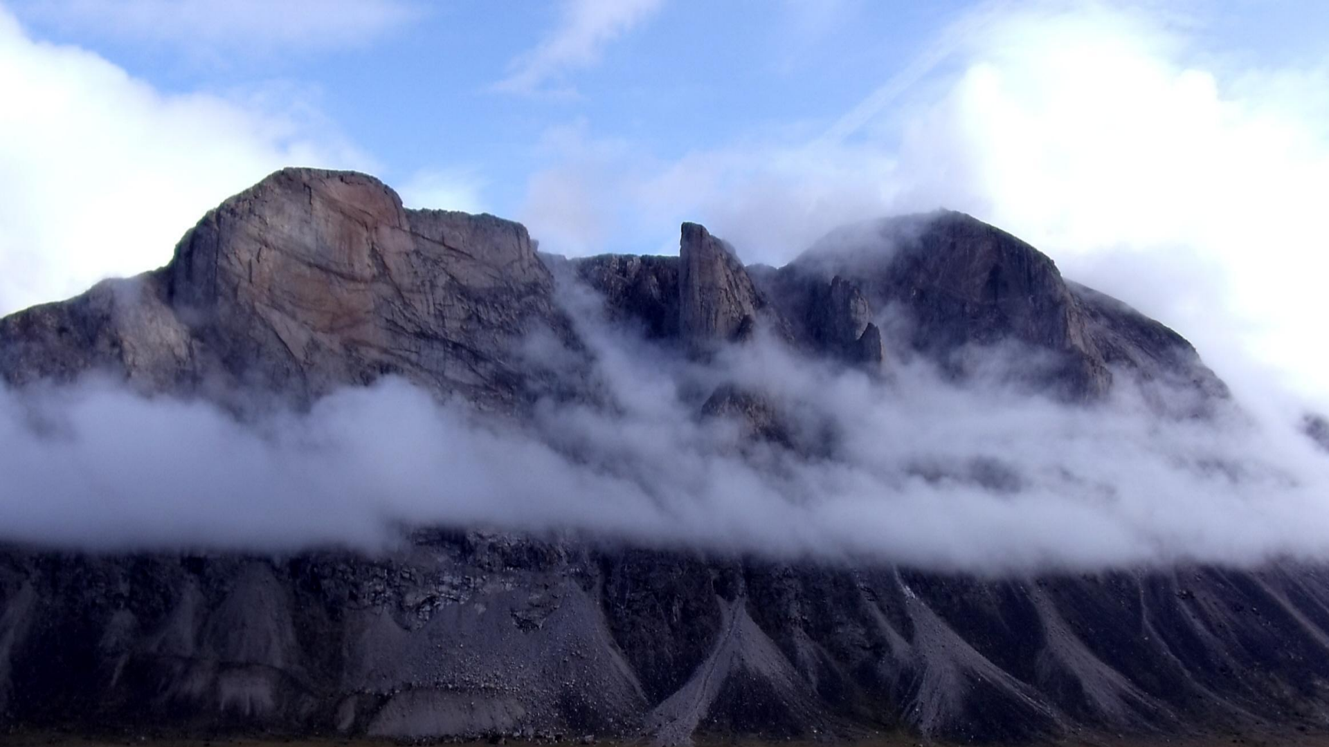
Auyuittuq National Park