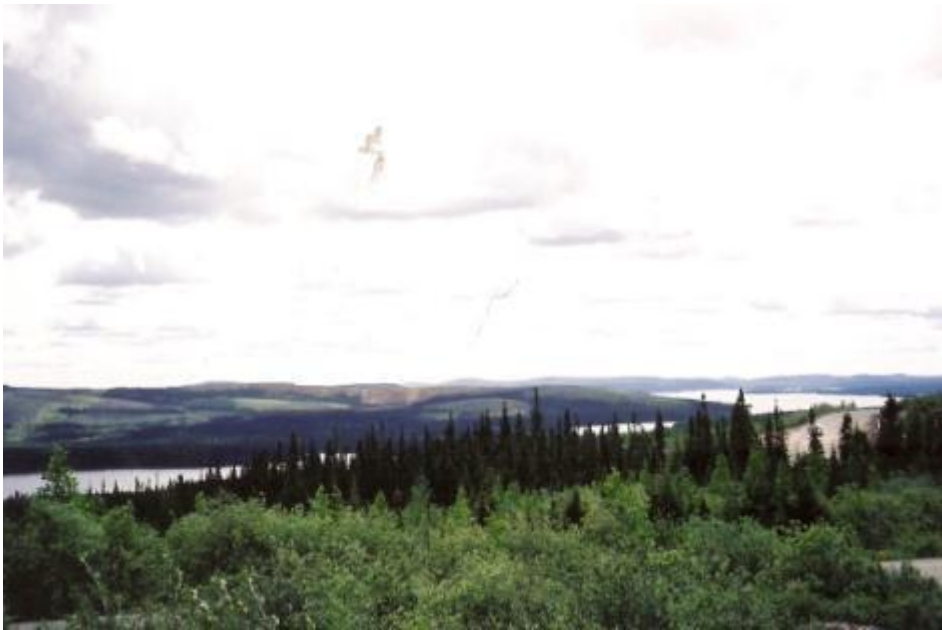
Природа п/острова Лабрадор.