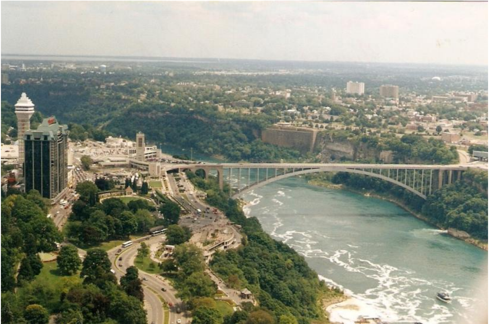
Мост «Дружба» между Канадой и США через Ниагару.