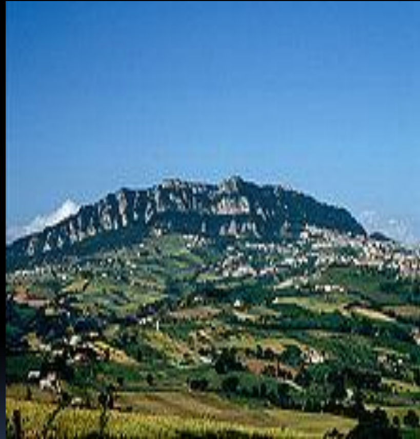
Гора Монте-Титано с её башнями — один из символов Сан-Марино

С 1985 года в Сан-Марино функционирует университет. С 1983 года в Сан-Марино открыта Международная академия наук Сан-Марино — международная научно-образовательная организация с штаб-квартирой в словацком городе Комарно. Рабочими языками академии являются немецкий, английский, французский, итальянский и эсперанто. Академия наук Сан-Марино присуждает международные учёные степени: бакалавра, магистра, доктора и доктора высшей степени.