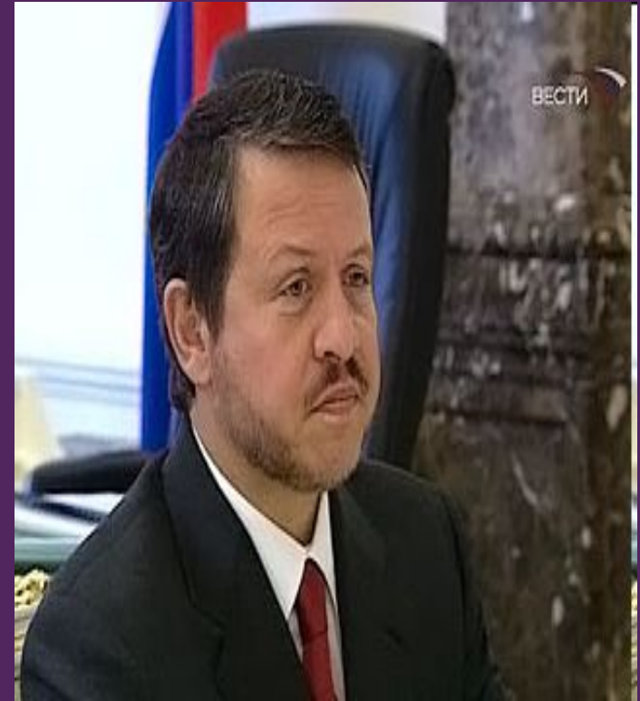
Капитан-регент Франческо Муссони

Герб Сан-Марино появился в XIV веке. Это символ свободы и суверенитета самой старой республики в мире.