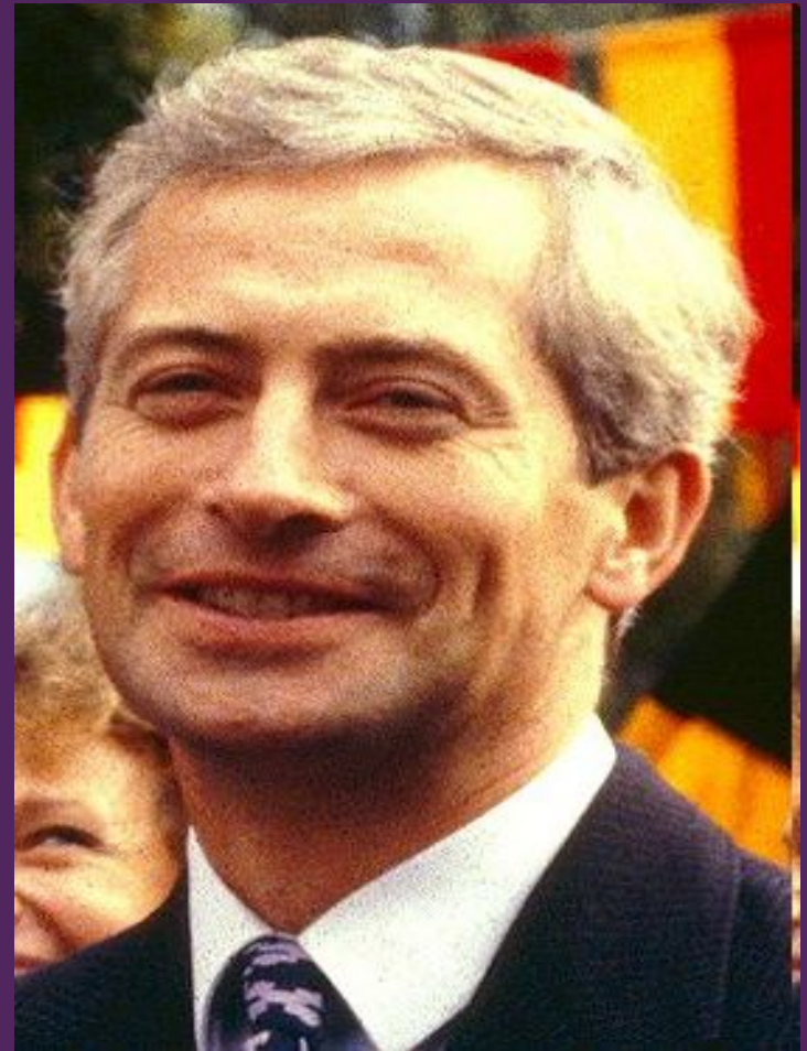
Князь Ханс-Адам II

Герб княжеского дома Лихтенштейн также используется в качестве национального герба.