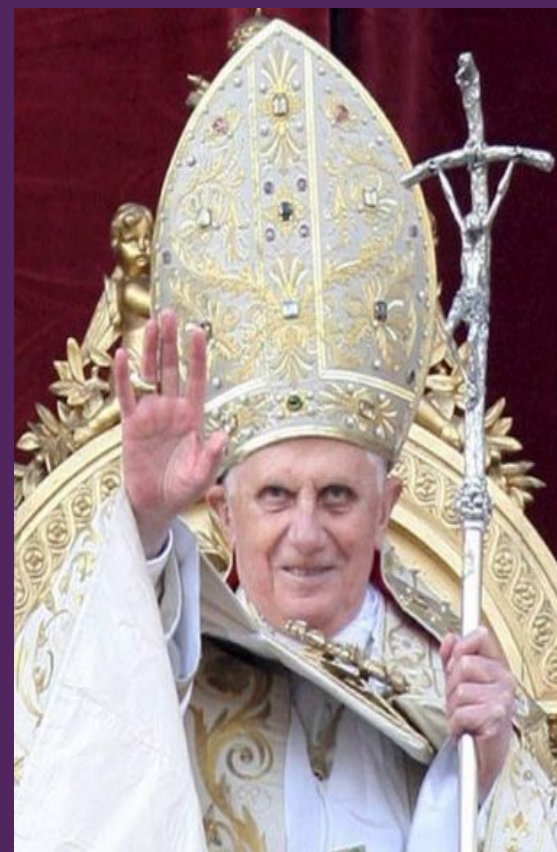
Римский Папа Бенедикт XVI

Герб Ватикана — представляет собой щит красного цвета, на котором изображены два скрещенных ключа (от Рая и Рима). Над ключами расположена папская тиара.