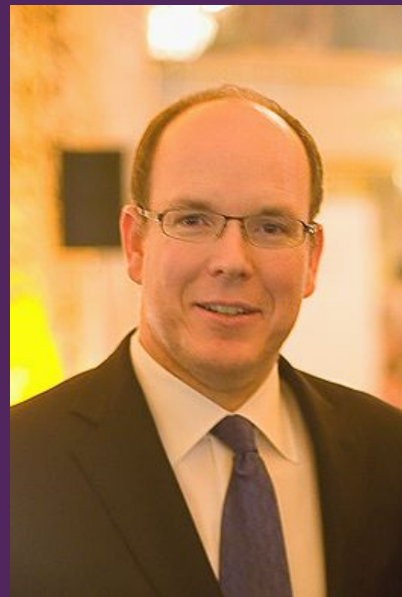
Князь Альберт II