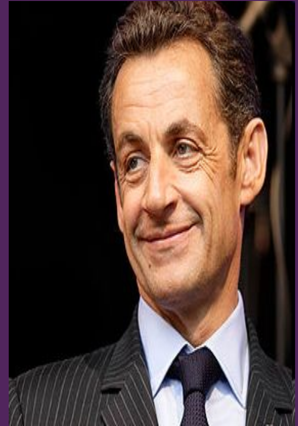
Князь Николя Саркози