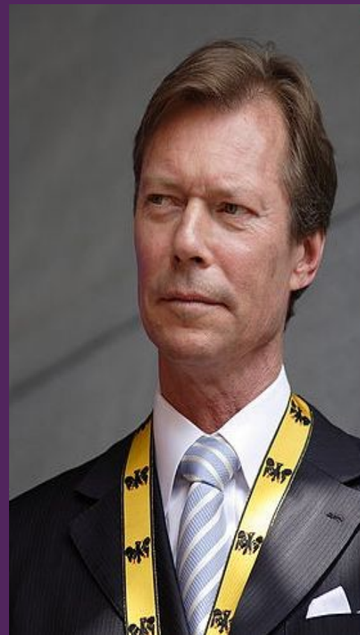
Великий Герцог Анри (Генрих)

Герб представляет собой щит с 10 горизонтальными синими и серебряными полосами. На гербе лев с золотым языком.