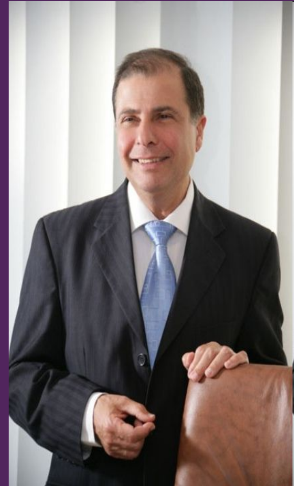
Президент Джордж Абела

Щит, представляющий геральдическое изображение флага Мальты.