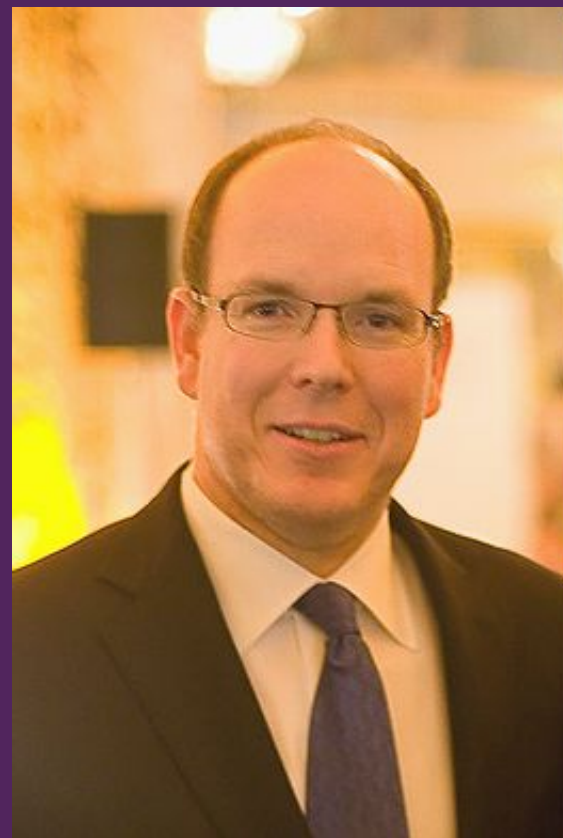
Князь Альберт II