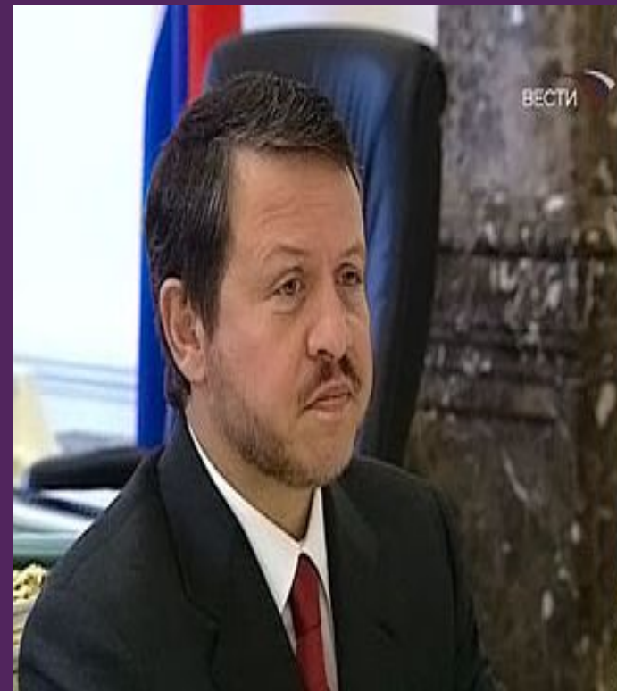
Капитан-регент Франческо Муссони

Герб Сан-Марино появился в XIV веке. Это символ свободы и суверенитета самой старой республики в мире.