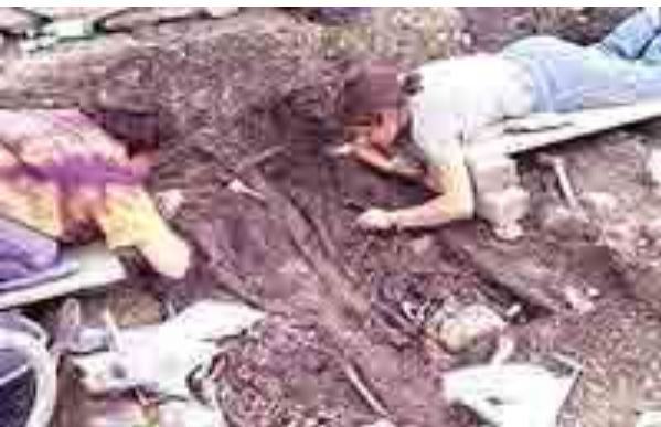
Раскопки возле Гутенберга