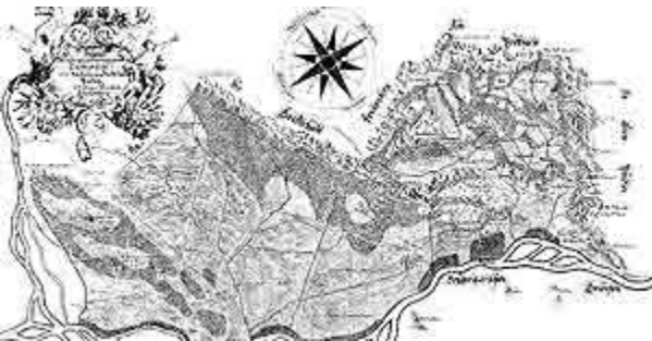
Старинная карта княжества

Территория современного Лихтенштейна была заселена еще в ранний период каменного века. В 15 году до н. э. территория была освоена римлянами, однако уже в V в. н.э. они были вынуждены уступить ее германским племенам. В средние века здесь господствовали представители нескольких знатных родов. Лишь в 1396 году оформился государственный статус графства Вадуц.