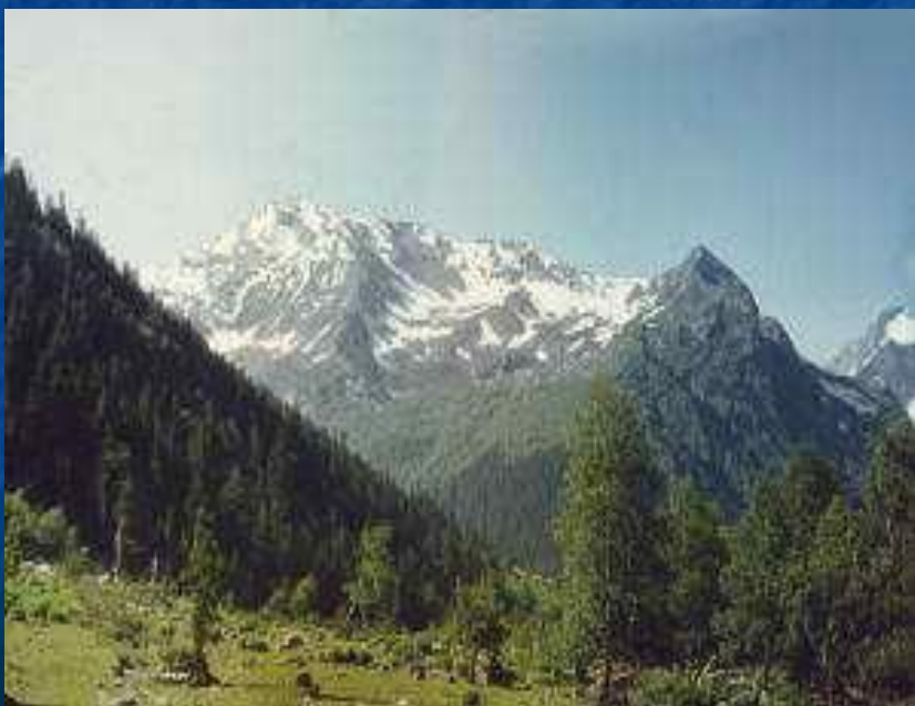
Фото. Горы Кавказ

«Кавказ подо мною. Один в вышине Стою над снегами у края стремнины: Орел, с отдаленной поднявшись вершины, Парит неподвижно со мной наравне.