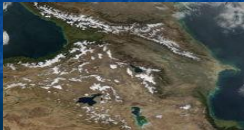
Снимок из космоса. Кавказ.