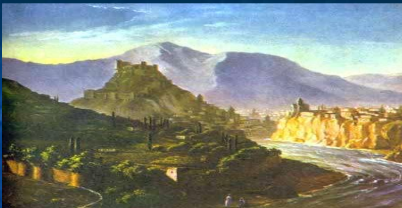
М.Ю. Лермонтов. Северный Кавказ.