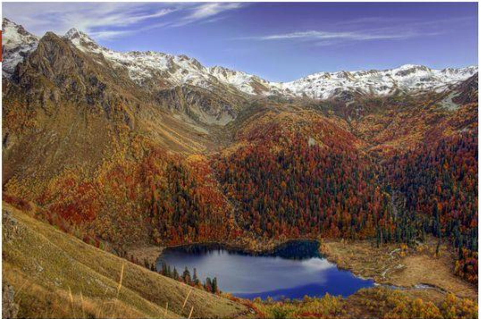
Озеро Кардывач (Красная Поляна, 1883 м)