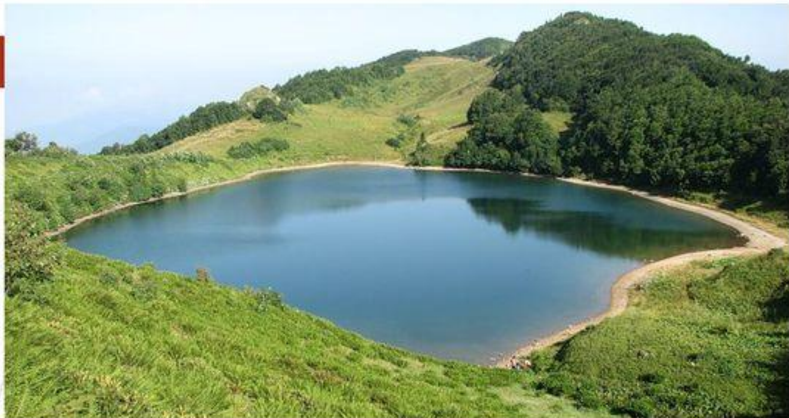
Озеро Хуко (верховья реки Шахе, 1740 м)