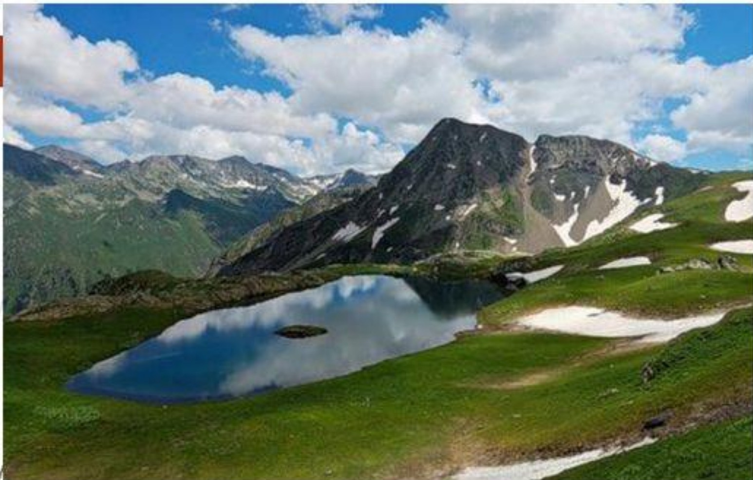
Озеро Клумбочка (хребет Аишха, 2400 м)