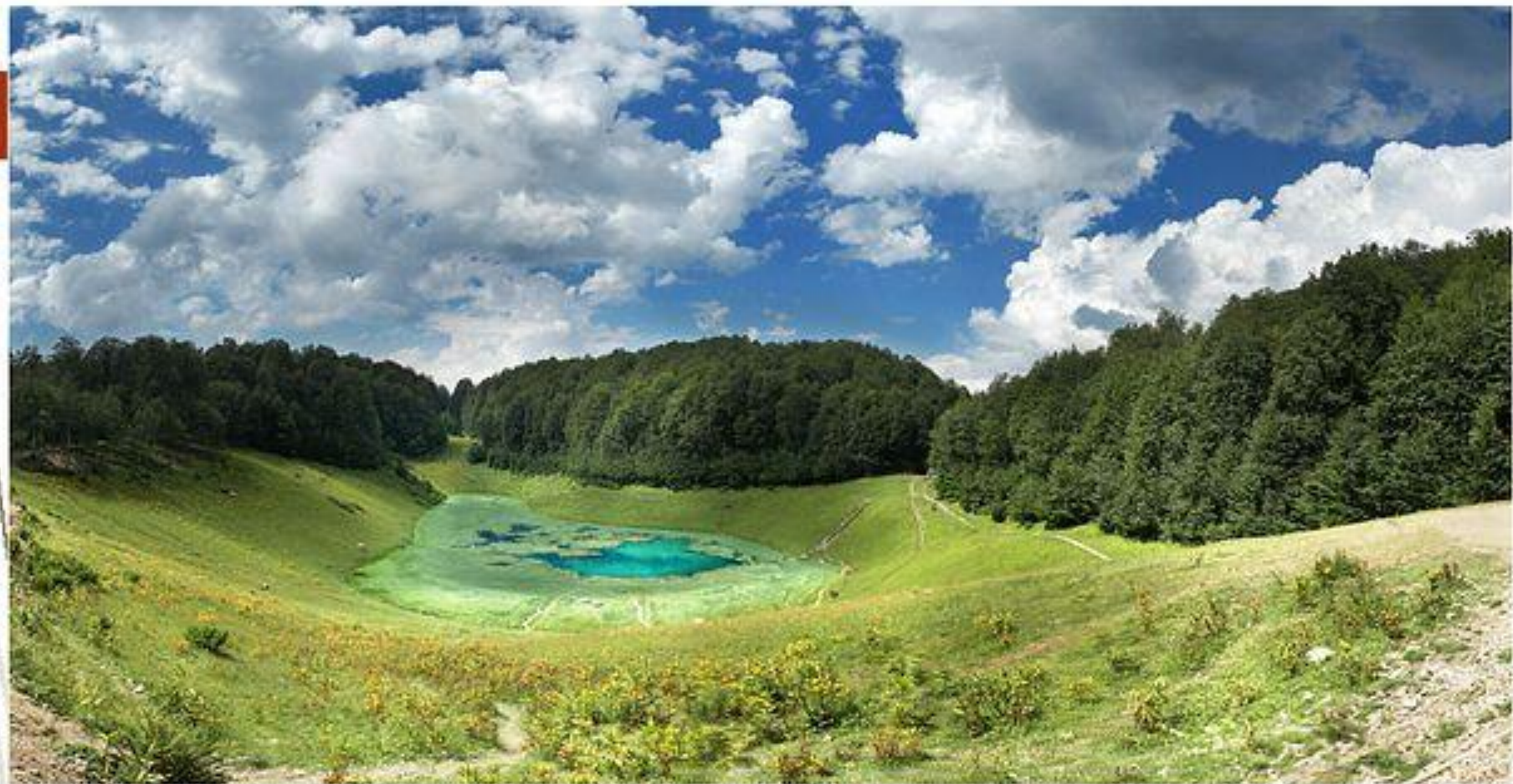
Озеро Хмелевского (г. Ачишхо, 1800 м)