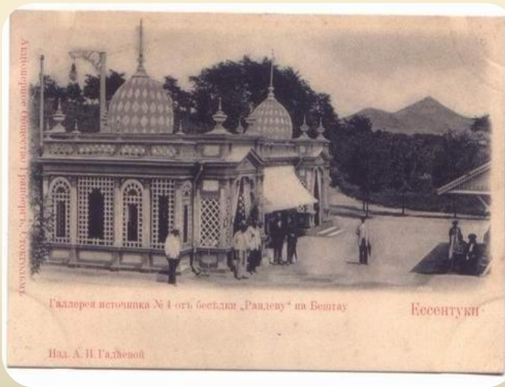
Галлерея источника № 4 отъ беевди „Рандеву“ на Бештау