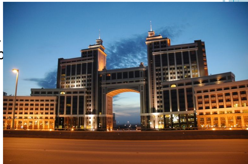
Здание национальной нефтяной компании КазМунайГаз