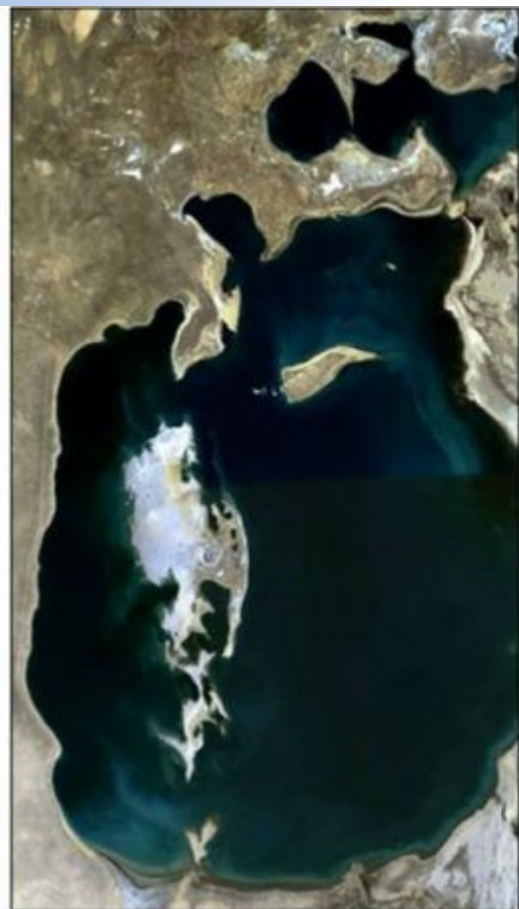
July – September, 1989