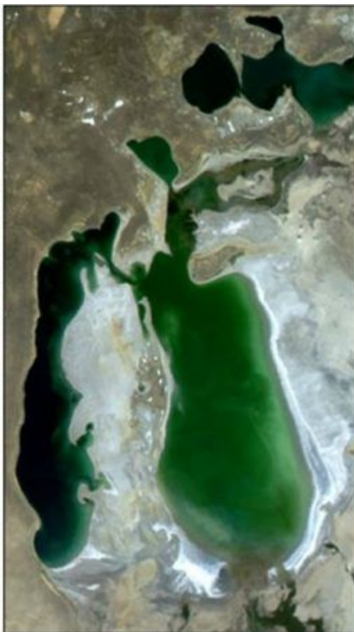
August 12, 2003