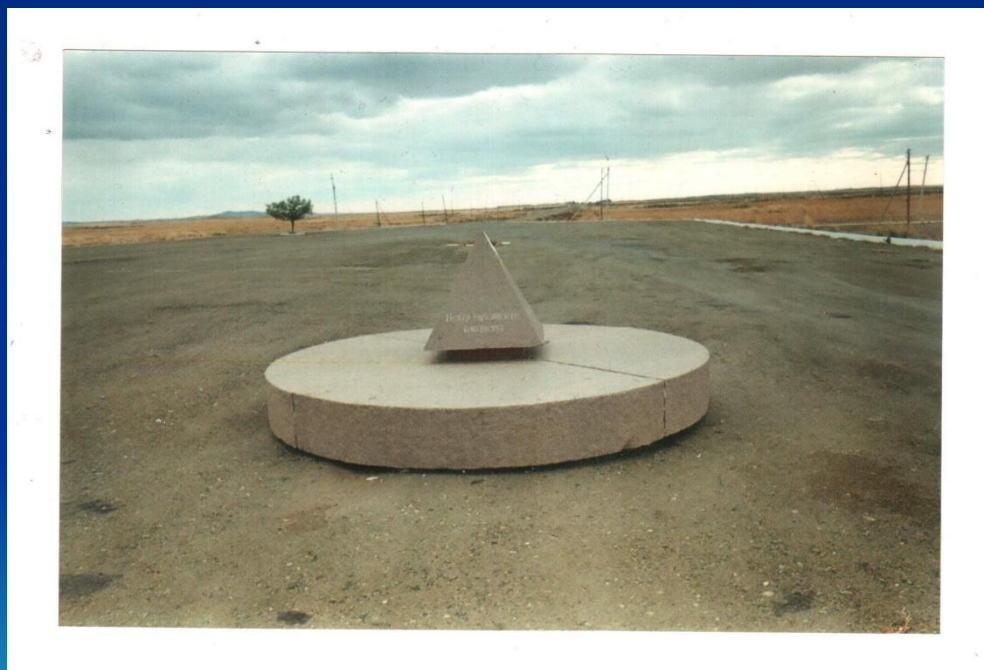
Памятный знак «Центр Евразийского континента» в урочище Жетыбай Восточно-Казахстанской области