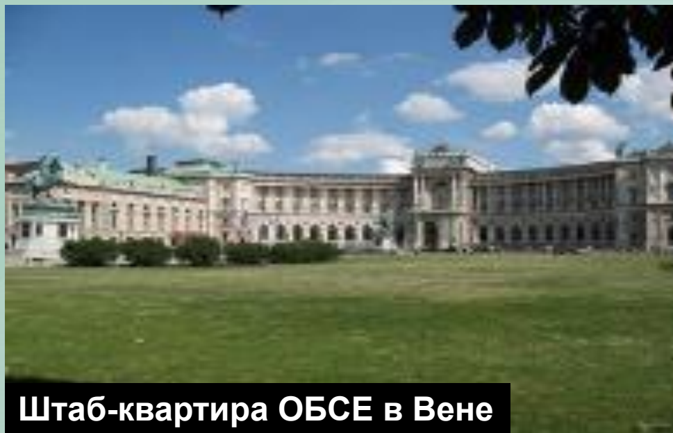
Штаб-квартира ОБСЕ в Вене