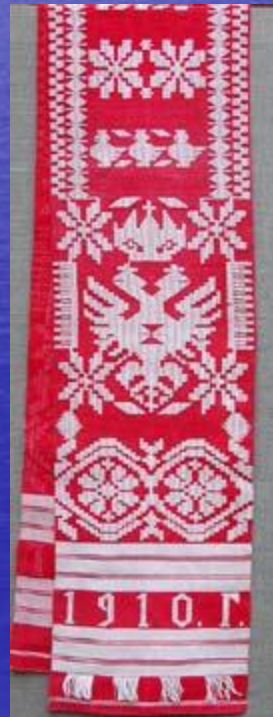
РУШНИК. Кролевець. 1910 р. Центральна Україна.