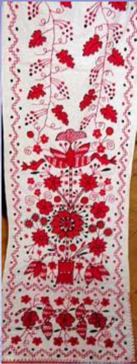
РУШНИК. Полуднівка Чигиринського району. Центральна Україна. Кін. ХІХ – поч. ХХ-го ст.