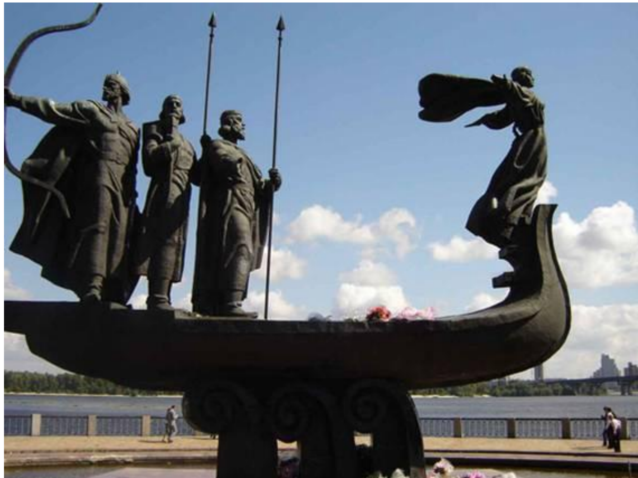
Памятник Кию, Щеку, Хориву и Лыбеди

С тех пор минуло много лет. Пришли на холмы три брата - Кий, Щек и Хорев, и с ними сестра их Лыбедь. Предание говорит, что Кий был перевозчиком через речку Днепр. По его имени называли эту местность Киев перевоз (т.е., другими словами – Перевоз Кия ). А потом так стали называть и город, который вырос на этом месте. Город рос, развивался... а имя его наоборот уменьшилось. Где-то в глубинах истории потерялось слово «перевоз» и осталось только слово «Киев».