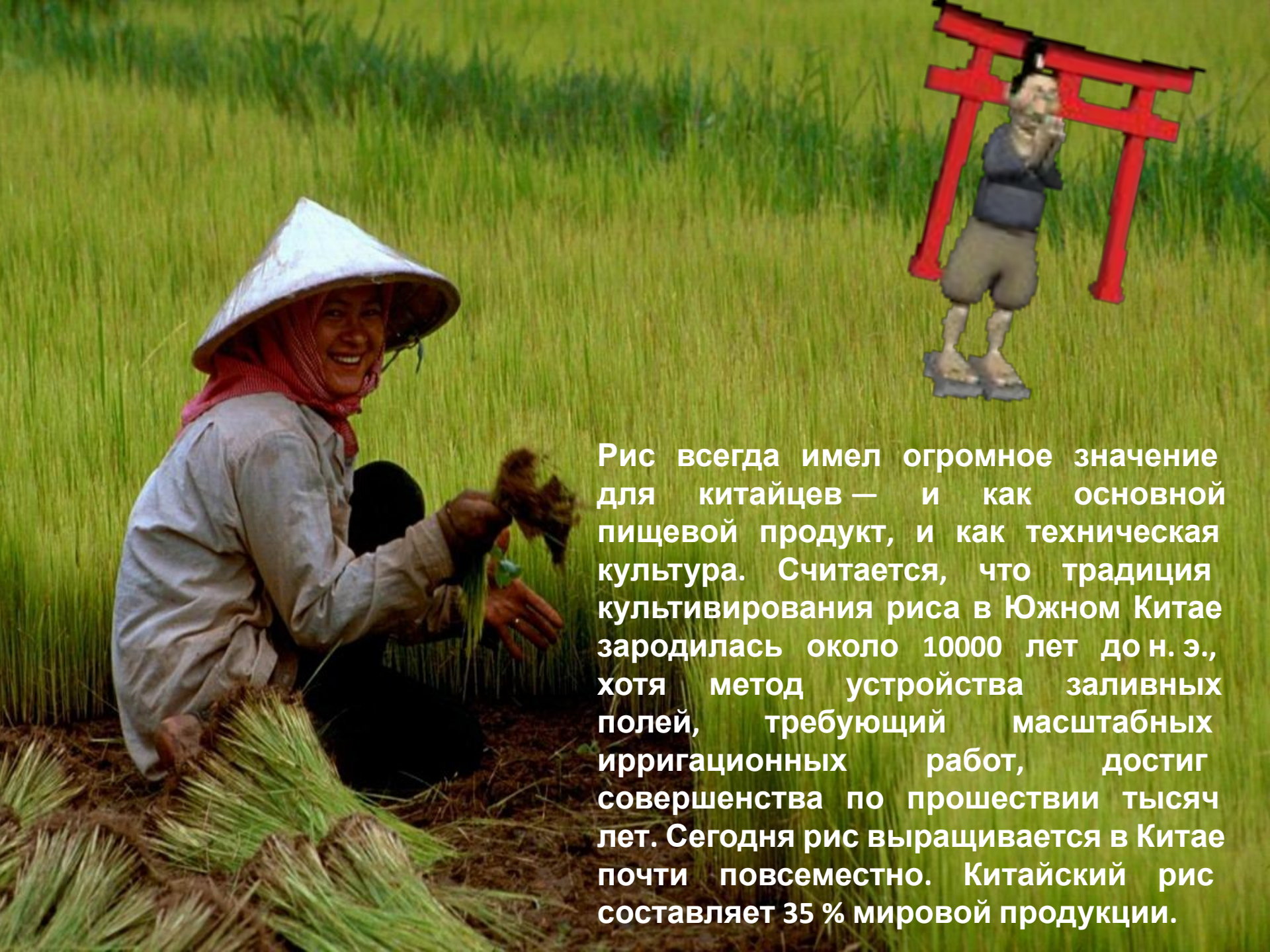
Рис всегда имел огромное значение для китайцев — и как основной пищевой продукт, и как техническая культура. Считается, что традиция культивирования риса в Южном Китае зародилась около 10000 лет до н.э., хотя метод устройства заливных полей, требующий масштабных ирригационных работ, достиг совершенства по прошествии тысяч лет. Сегодня рис выращивается в Китае почти повсеместно. Китайский рис составляет 35 % мировой продукции.