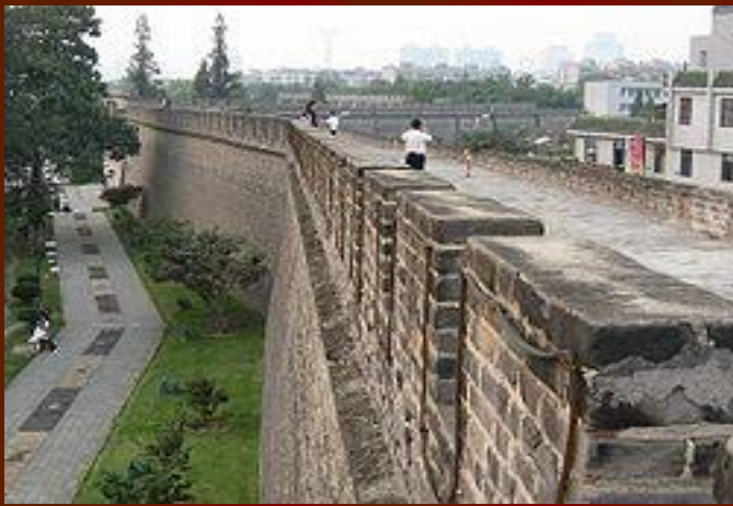
Городская стена города Сянфань