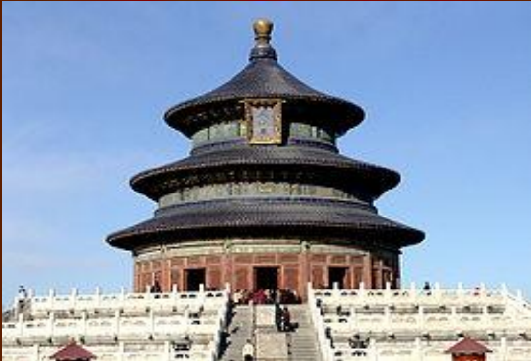
Символ Пекина- Храм Неба

Пекин (в нормативном произношении — Бэйцзин , кит. 北京, пиньинь Běijīng ) буквально означает «Северная столица», следуя общей для Восточной Азии традиции, согласно которой столичный статус прямо отражается в названии. Яньцзин уходит корнями к древним временам династии Чжоу уходит корнями к древним временам династии Чжоу , когда в этих местах существовало царство Янь уходит корнями к древним временам династии Чжоу , когда в этих местах существовало царство Янь. Это название отражено в названии местной марки пива ( Yanjing Beer уходит корнями к древним временам династии Чжоу , когда в этих местах существовало царство Янь. Это название отражено в названии местной марки пива (Yanjing Beer) и в названии Яньцзинского университета уходит корнями к древним временам династии Чжоу , когда в этих местах существовало царство Янь. Это название отражено в названии местной марки пива (Yanjing Beer) и в названии Яньцзинского университета (позднее вошёл в состав