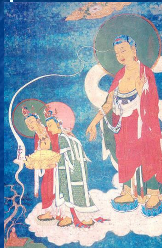
Встреча Буддой умершего праведника