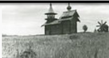
Часовня Михаила Архангела.