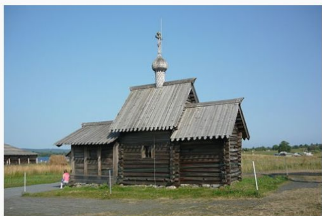
Церковь Воскрешения Лазаря —

Также на острове есть и другие достопримечательности: Церковь Воскрешения Лазаря, Часовня Михаила Архангела, Восьмикрылая ветряная мельница и прочие.