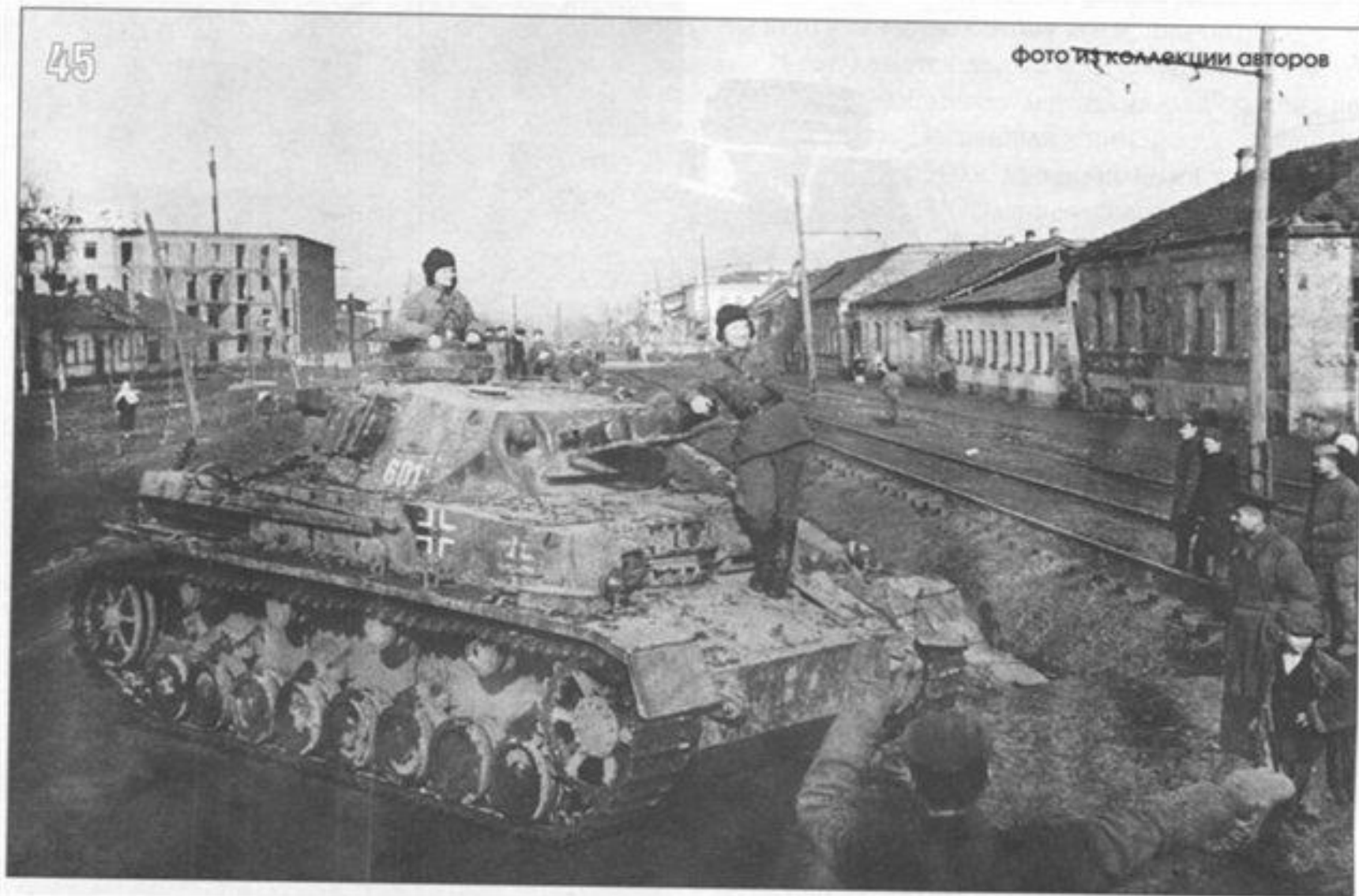
Северо-Кавказский фронт. г.Краснодар.