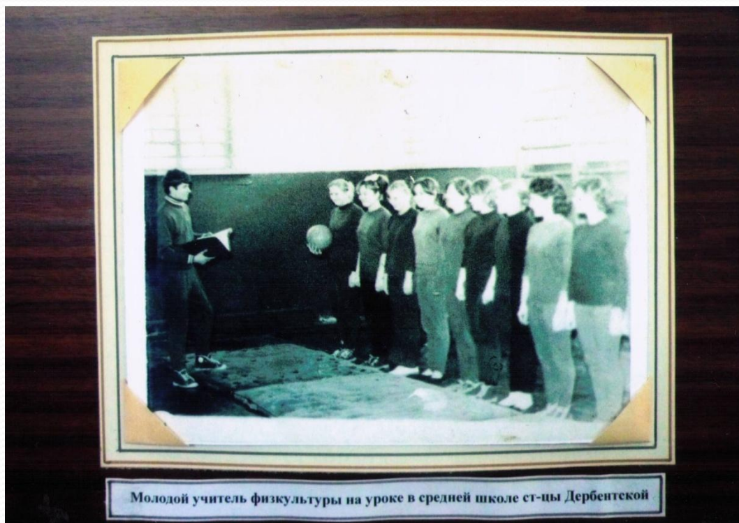
Молодой учитель физкультуры на уроке в средней школе ст-цы Дербентской

В дербентской школе он вёл уроки физкультуры в 5-8 классах.